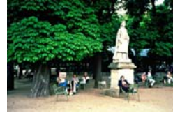
Situation n° _____