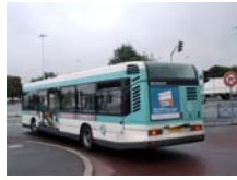
Situation n° _____