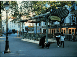
Situation n° _____