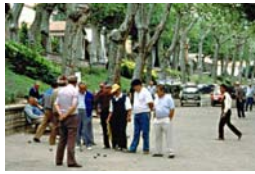
Situation n° _____