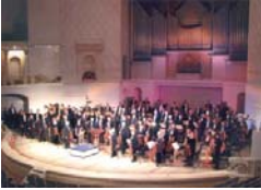
Situation n° _____