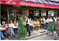
Situation n° _____