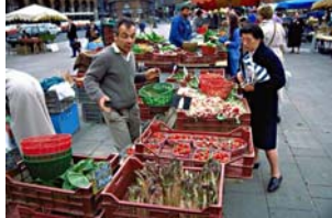
Situation n° _____