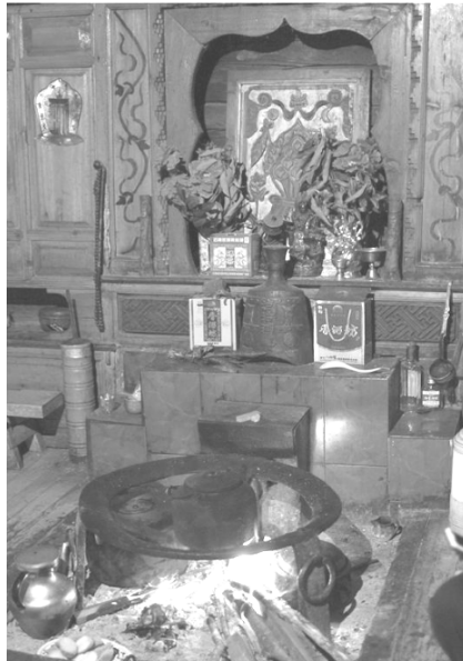
<그림 2> 티베트 일반 가정에서의 '火塘'

우선 TT에 '화로'로 번역한 '火塘'이다. '火塘'을 '화로'로 번역하는 것은 다음 두 가지 점에서 생각해 볼 여지가 있다. 하나는 의미적 등가의 실현이다. 티베트의 독특한 문화에서만 존재하는 '火塘'은 일반적으로 TT에서 '화로'로 번역되는 '火炉'와는 모양도 기능도 다른 개념이다. 아래 <그림 2>를 보면 '火塘'이 단순히 '火炉'의 사투리이거나 유사한 어휘가 아니라는 점을 확인할 수 있는데, 그 결과 도착어권에서 '화로'로 번역한 '火塘'은 '의미적 등가의 효과(principle of equivalent effect)'구현(Nida 1964:159)에는 실패하고 있다.