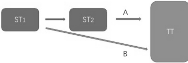
<그림 1> 소수 민족 인명 음가 번역의 두 가지 방식