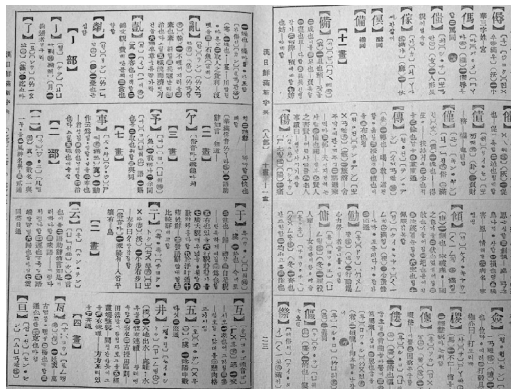
[그림 2] 『한일선만신자전』의 본문

『한일선만신자전』은 [그림 2]에 나와있듯이 한자, 한자음에 대한 한글 표기, 한음(漢音)과 오음(吳音)의 가타카나 표기, 중화음(中華音)의 주음자모(注音字母), 한글, 성조 표기, 만주음(滿洲音) 5) 의 주음자모, 한글, 성조 표기, 운(韻), 한문 해설과 이에 대응하는 한글 해설로 이루어