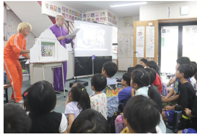
[그림2] 주뉴도를 소재로 한 종이그림연극