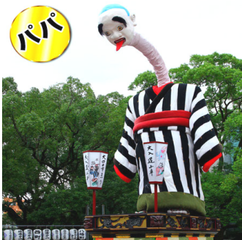
[그림3] 고뉴도군의 아빠 오뉴도 22)

유타카이치시 공식 마스코트 캐릭터 고뉴도군은 유타카이치市 지정 100주년을 기념하는 해인 1997년에 탄생하여 시를 홍보하는 각종 이벤트 등에서 활약하고 있다. 유타카이치의 요괴 오뉴도[그림3]의 아들이라는 설정으로 아버지와 같이 하얀 얼굴에 큰 눈, 긴 혀를 짹짹 늘어뜨리는 모습을 하고 있다[그림4]. 아빠처럼 목을 쪽 뺏거나 눈알을 굴리지는 못하지만, 누군가 공부나 운동을 잘하고 싶다면 ‘잘하고 싶다’는 소원을 빌면서 고뉴도군의 길게 뺏은 혀를 만지면 소원이 이루어진다고 한다. 고뉴도군은 아빠를 아주 좋아해서 언젠가 아빠처럼 되고 싶다는 아빠를 자랑스러워하지만, 1년에 두 번밖에 만날 수 없기에 늘 만날 날을 손꼽아 기다린다는 스토리를 갖고 있다. 상점가에 있는 주뉴도가 삼촌이라는 설정이므로 자주 만나고 있다.