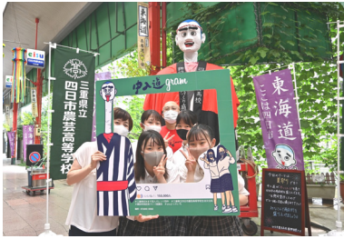
[그림1] 주뉴도와 인스타 사진액자

릭터인 ‘고뉴도군’의 삼촌이라는 설정으로, 많은 주민으로부터 사랑을 얻고 있다.