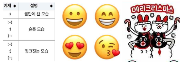
[Fig. 1] 1, 2, 3세대 이모티콘 예시

이모티콘은 감정(Emotion)과 아이콘(Icon)의 합성어로, 이미지의 형태로 감정 또는 비언어적 표현을 전달할 수 있도록 고안된 시각적인 기호이다. 그림의 형태로 다양한 감정을 표현하기 때문에 한글로는 '그림말'이라고도 불린다. 4) 이모티콘은 문자, 기호, 숫자로 구성된 1세대 이모티콘과 텍스트콘에서 간단한 그림으로 구성된 2세대 이모티콘인 그래픽콘 그리고 이모지(Emoji)를 거쳐 움직임이 있는 이모티콘인 애니콘(Anicon : Animation+Icon), 소리가 나는 이모티콘인 사운드콘(Soundcon, Sound+Icon)과 같은 3세대 이모티콘으로 발전하였다. 또한 모바일 인스턴트 메신저 앱에서는 자체적으로 메신저 브랜드를 대표하는 캐릭터 이모티콘을 개발하여 이용자들에게 제공하고 있다.