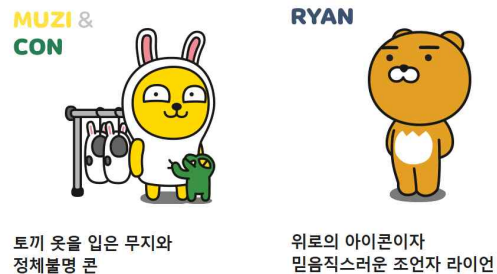
토끼 옷을 입은 무지와 정체를 숨긴 콘