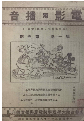
[그림 2] <영화와 라디오> 1942년 제1권 5부, 겉표지

1942년 금릉대학교와 손명경은 중국 초기 영화 이론을 담은 전문 월간 학술지<영화와 라디오>을 출판한다. <영화와 라디오>는 해외 영화계와 방송계, 전화(電化) 교육에 대해 주목하고 대량의 국내외 영화 이론과 영화 정보를 담아낸다. 그 중에는 애니메이션 이론과 평가, 그리고 애니메이션 영상에 대한 최신 정보도 포함되어 있다. <영화와 라디오>는 학술지로서 초기 영화·애니메이션 이론과 서양 애니메이션 정보를 소개한 최초의 전문잡지로 초기중국애니메이션 교육에 중요한 역할을 하였고, 중화민국 시기 애니메이션과 영화이론 연구의 중요한 역사적 자료가 되었다. 1942년 발간된 <영화와 라디오>제1권, 5부에서는 디즈니 애니메이션의 미키마우스, 도널드 덕, 구피를 첫 면에 소개하고 있다. 또한, 제2권의 1부에는 디즈니의 새로운 애니메이션 <드래곤>의 소개와 함께 1943년 11월 20일 자 월트 디즈니가 손명경에게 보낸 서신 ; <애니메이션 대가, 디즈니의 미래 활동>을 통해 애니메이션의 교육적 기능이 전시(戰時)상황에 있어 필요한 중요성을 밝히고 있다.