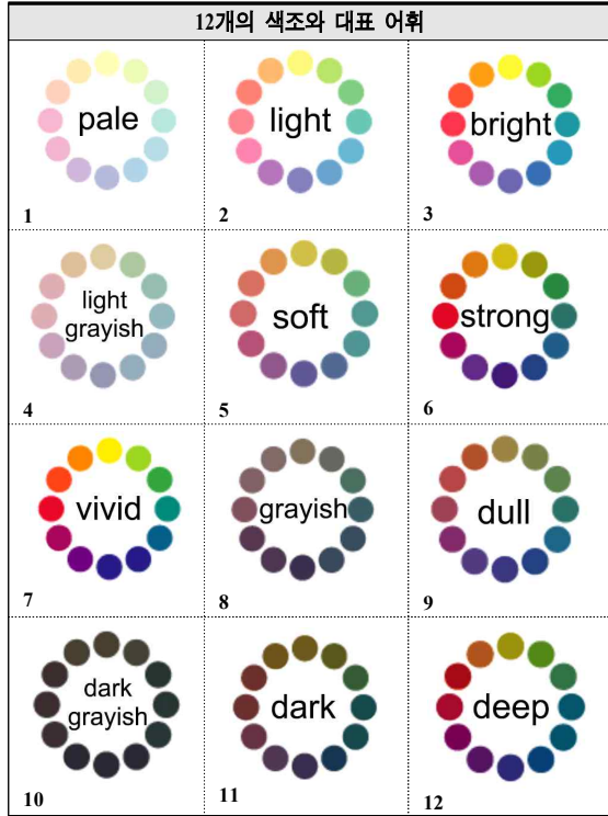
[Table 2] PCCS의 12개 색조