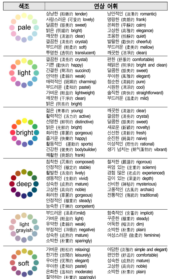
[Table 6] 색조별 연상어휘 조사표

색조 이미지에 대해 연상되는 어휘를 고르는 조사에서 30회 이상 선택된 어휘들을 정리한 결과는 [Table 6]과 같다. 이 어휘들은 각 색조가 사람들에게 전달하는 이미지를 대표한다고 할 수 있다.