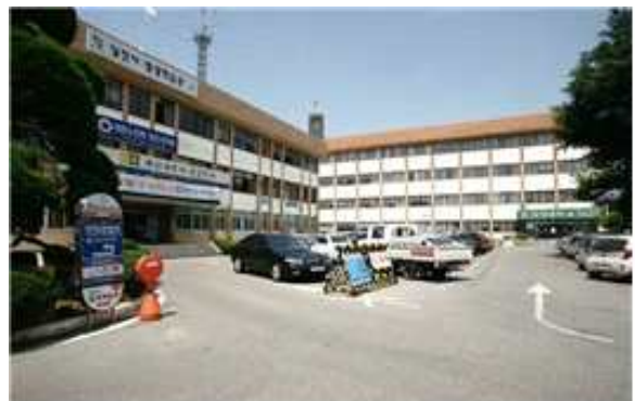
[그림 2] 구 당진청사

패밀리비전타워의 공간적 범위는 충청남도 당진시 당진중앙1로 59. 당진 구 군청으로 현재 예산세무서 당진지사, 신성대학교 평생교육원, 신성대학교 창업지원센터, 당진인적자원개발센터, 대한노인회 당진지회, 해나루 시민학교, 당진시 평생학습관, 당진시 어린이 급식관리지원센터 등으로 활용되고 있다.