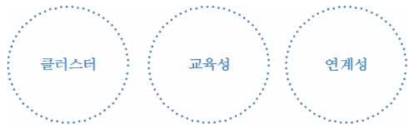
[표 3] 패밀리비전타워 컨셉 방향

패밀리비전타워를 통해 당진시의 교육과 문화, 경제를 아우를 수 있는 기회와 제도적 공간을 제공해줄 뿐만 아니라 당진시민의 시민의식 고취시킬 수 있다. 특히 당진시는 20~30대 젊은 부부가 많이 거주하고 있고 지속적인 인구 유입으로 출산율 증가가 기대된다. 자녀 교육비 지출이 높은 고소득층이 많이 거주하고 있고 주변 수도권과도 40km 이내 거리로 연계가 가능하다.