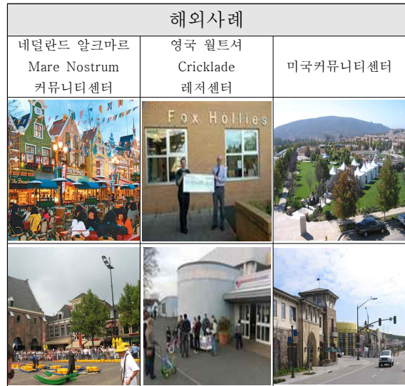
[표 2] 해외사례 복합 문화 공간

국내외는 외국에 비해서 문화 복지시설에서 진행되는 대부분의 프로그램들은 전문 기획 인력의 부재로 단순한 취미와 오락을 위한 강습에 그치는 경우가 많으며, 주민들의 능동적, 적극적 문화여가 참여를 위한 프로그램이나 시설을 제공하는 데에는 한계를 보이고 있다.