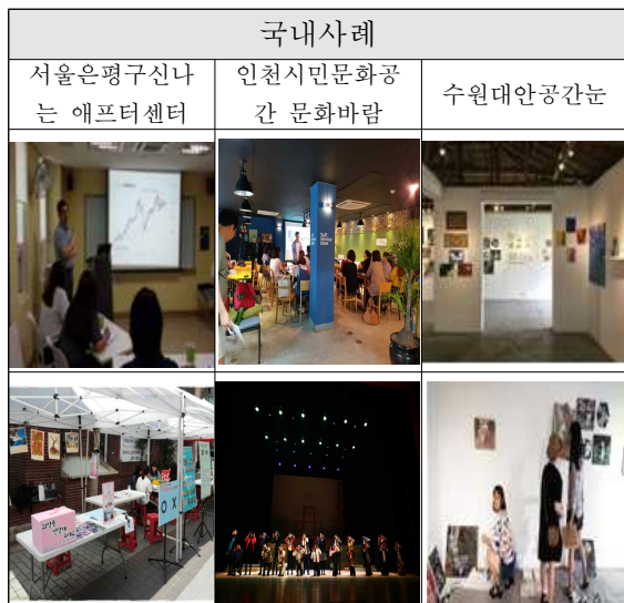
[표 1] 국내사례 복합 문화 공간

알크마르는 네덜란드 북서부 노르트홀란드 주에 위치한 ‘알크마르 Mare Nostrum 커뮤니티 센터’는 음악연습과 연극연습을 할 수 있는 연습실, 극장, 무대가 있는 넓은 홀, 연회장, 스크린과 프로젝터 등 시설과 아동프로그램, 청소년 프로그램 등이 있으며 요일별로 각각 다른 프로그램이 진행되고 있다. ‘영국의 버밍엄 Fox Hollies 레저센터’는 유아동과 어른을 구분해 각각의 연령대에 맞는 1:1교육 혹은 팀을 이루어 교육하는 프로그램부터 취업에 관련한 상담과 취업연계시설을 구축되어있다. 미국 San Marco에 위치한 ‘San Elijo Hills Village Center’는 중앙의 Village Square를 중심으로 소매 업무시설, 주민자치센터, 복지시설, 교육시설을 배치하고 초등학교와 중학교가 복합된 캠퍼스 형태의 학교시설로 구성되어 있다. 미국의 커뮤니티센터는 규모나 명칭 등이 다양하고 소규모 지역단위로 배치되고 있으며, 운영은 정부와 비영리 민간기관이 서비스 구매계약을 맺고 파트너십 체계 구축으로 서비스의 효율성을 증대시키는 방식으로 이루어진다.