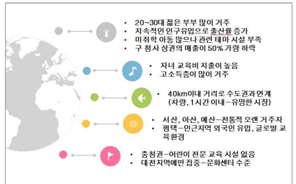
[표 4] 기본여건 분석표

기본 여건에 따른 과업 방향으로 첫째, 기본 컨셉 및 전략도출로 당진시의 독창성, 차별성을 통한 경쟁력으로 경제, 환경, 문화적 드림 센터의 수립하고 둘째, 주제 및 소재도출로 컨셉에 맞는 네이밍 제안과 성공전략에 맞는 전개 방안 제시한다. 셋째, 성공사례 연구 및 벤