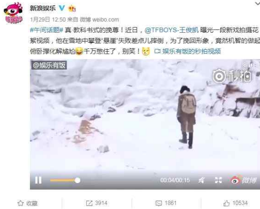
[Fig. 2] 시나 웨이보 콘텐츠 게시 유형(동영상+글자)