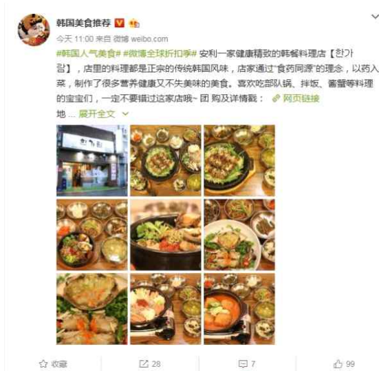
[Fig. 1] 시나 웨이보 콘텐츠 게시 유형(이미지다수+글자)

시나 웨이보에서 사용하고 있는 대표적인 콘텐츠 제공 유형은 글자, 이미지, 음악, 링크 그리고 동영상 등이 있다. 사용자는 다양한 미디어를 중의 한 가지나 또는 그 이상 유형을 조합하여 만든 콘텐츠를 포스팅 하는데, 2016년 웨이보의 보고서 13) 에 따르면 사용자들이 가장 많이 이용하고 있는 유형은 이미지와 글자 조합(Fig.1)과 동영상과 글자 조합(Fig.2)을 많이 사용하고 있다.