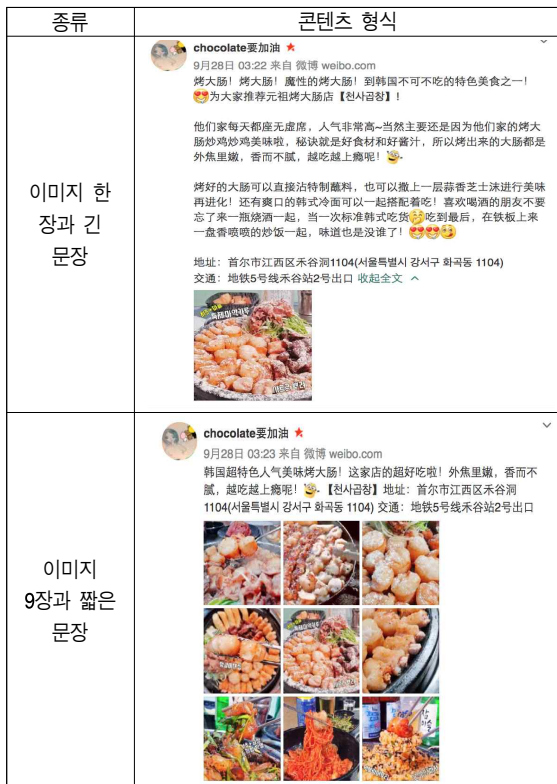
[Table 2] 실험 이미지

연구 가설을 검증하기 위한 실험은 총 3그룹으로 나누었으며, 한 그룹에 하나의 콘텐츠를 보고 질문에 응답하게 하였다. 설문을 진행하기에 앞서 실험이미지와 실험에 필요한 내용을 사전에 설명하였다. 설문 이미지는 Table 2와 같이, 한국 맛집과 관련된 콘텐츠로서 같은 내용을 첫째, 이미지 한 장과 긴 문장, 둘째, 이미지 9장과 짧은 문장 그리고 동영상과 짧은 문장 형식으로 만들어 이에 대한 소비자의 태도를 측정하였다.