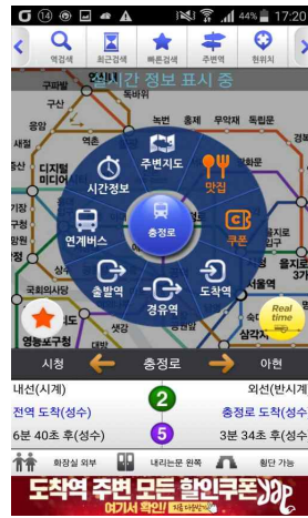
[Fig. 1] 지하철종결자 앱

서울시 전철 및 지하철은 1~9호선 구간 총 284개의 역으로 구성되었으며, 수도권 전철까지 포함하면 562개의 역으로 연결되어 있다. 이용자 수는 지속적으로 증가하고 있고, 출퇴근 이동수단 이외에 고령자 및 외국인의 이용 활동 증가 등 다양하게 변화되고 있다. 2) 이에 대중교통 관련 서비스의 질적 향상은 매우 중요한 과제로 대두되고 있는 상황이다.