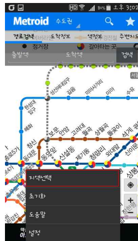
[Fig. 3] 지하철정보 앱