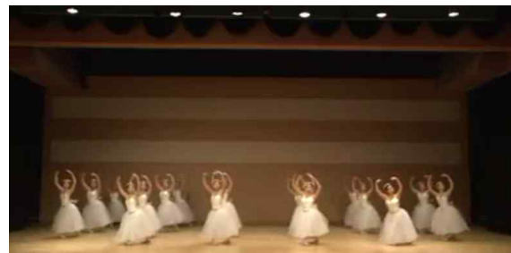
[Fig. 14] 부산대학교 10.16회관 'Les Sylphides'공연

2016년 5월 7일 부산대학교 10.16회관 공연은 부산광역시 국립 부산대학교 내에 위치한 300석 규모의 10.16 회관 소공연장 프로시니엄 무대에서 퍼넬 조명기 (Fresnel Spotlight) 만 사용된 기본 조명으로 조명 디자인과 광량의 변화 없이 공연되었다.