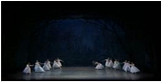
[Fig. 9] American Ballet 'Les Sylphides'공연