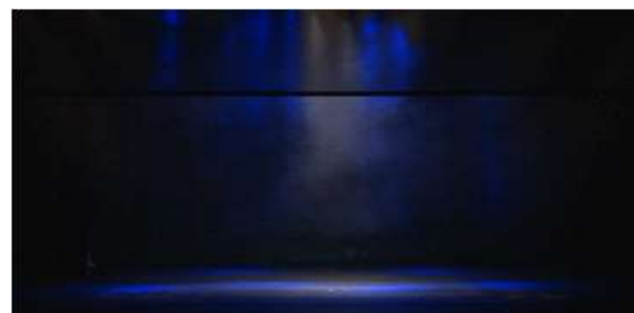
[Fig. 6] 부산 영화의 전당 대공연장 프로시니엄 무대

야외무대는 일반적으로 노천극장을 뜻하는 것이며 노천에 무대 등 간단한 시설을 추가하여 야외극이나 민속극, 연주회 등을 공연하는 곳을 말한다. 이러한 야외 공연장은 일반적인 극장과는 달리 자연적 기후조건 아래서 자연의 경치를 배경으로 하여 공연하는 장소이므로 관람객들로 하여금 기계화된 도시생활의 긴장을 풀게 하고 자연의 정취를 느끼며 자연 속에서 공연자와 관객이 한데 융화될 수 있게 해준다는데 큰 의미가 있다. 이러한 의미에서 야외무