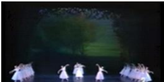
[Fig. 12] Kirof Ballet 'Les Sylphides'공연