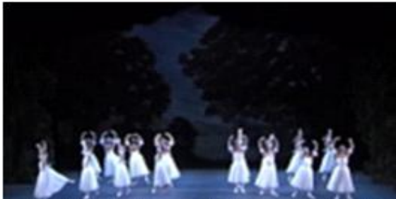
[Fig. 11] English National 'Les Sylphides'공연