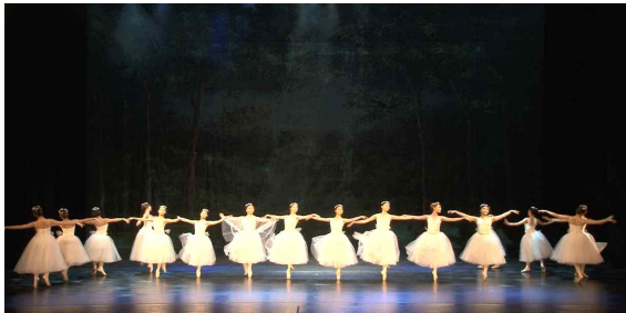
[Fig. 15] 영화의 전당 'Les Sylphides'공연

장 프로시니엄 무대와 기본조명기로 퍼넬 조명 기, 스페셜 조명기로 엘립소이드 조명기 (Ellipsoidal Reflect Spotlight)와 파캔 조명기 (Par Can Light)등이 사용되어 안무 상황에 따른 조명 광량이 조절되는 조명디자인으로 구성되었다.