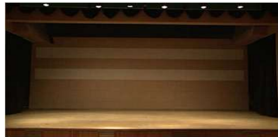
[Fig. 5] 부산대학교 10.16 회관 소공연장 프로시니엄 무대

본 연구에서는 프로시니엄 무대로 부산대학교 10.16 회관 내 소공연장 프로시니엄 무대와 부산 영화의 전당 내 대공연장 프로시니엄 무대를 선정하여 진행하였다.