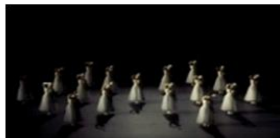
[Fig. 8] New York City Ballet 'Les Sylphides' 공연

세계 유명 무용단들의 'Les Sylphides' 공연들 중 2015년 david H Koch Theatre에서 공연된 Newyork City Ballet의 공연, 1984년 Opera Metropolitana에서 공연된 American Ballet Theatre의 공연, 1970년도 British Royal Ballet의 공연, 2010년 English National Ballet의 공연, 1999년 Teatro Real에서 공연된 Kirof Ballet의 공연, 2012년 Bolshoi Theatre에서 공연된 Bolshoi Ballet의 공연 등 6회의 'Les Sylphides' 공연을 선정하여 공연이 이루어진 무대의 종류와 조명에 대하여 조사하였다. 총 6가지 사례를 분석한 결과 모든 공연이 정형화된 프로시니엄 무대에서 변화가 없는 기본 퍼널 조명((Fresnel Spotlight)으로 공연되었다. 세계 유명 무용단들의 이러한 사례들을 통하여 'Les Sylphides' 공연이 무대의 종류와 조명 디자인 등 무대 디자인적 요소의 변화를 주지 않는 상징주의를 대표하는 공연임을 보여주고 있다.