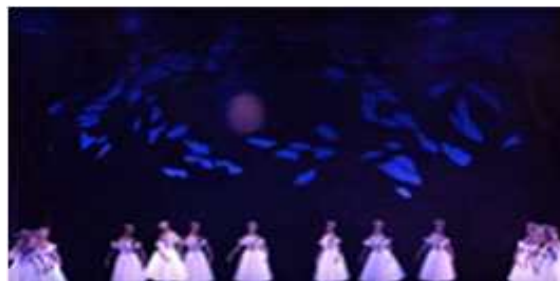
[Fig. 13] Bolshoi Ballet 'Les Sylphides'공연