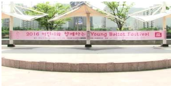
[Fig. 7] 부산광역시 센텀 나루공원 야외무대

대는 가정이나 직장의 분주한 생활환경에서 벗어나 심신의 휴양을 취하기 위해 찾아오는 사람들에게 위안을 주며, 공간의 이미지와 축제 문화의 이미지를 하나로 조화시켜 친근감을 느끼게 하고 즐길 뿐만 아니라 교양함양을 위한 장소로 제공하여 주는 공간으로 볼 수 있다. 6) 본 연구에서는 야외무대로 부산광역시 센텀 나루공원 야외무대를 선정하였다.