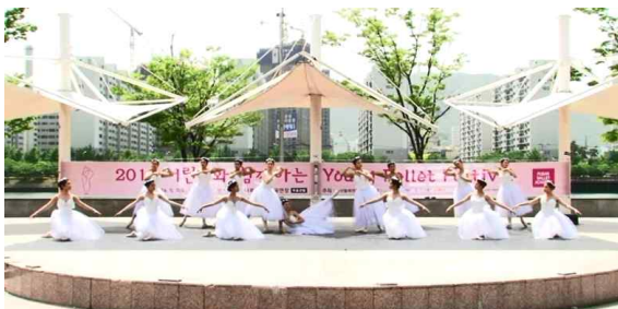
[Fig. 16] 센텀 나루공원 'Les Sylphides'공연

2015년 7월 29일 공연된 센텀 나루공원 공연은 부산광역시 센텀 나루공원 내 야외무대에서 공연되었으며 실외 개방 돌출 무대 형식과 자연광 조명으로 이루어졌다. 무대와 거리를 두고 관객석이 타원형으로 마련되어 있지만 공원 내에 위치한 특성상 자유로운 관람이 가능한 특징이 있다.