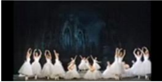
[Fig. 10] British Royal Ballet Ballet 'Les Sylphides'공연