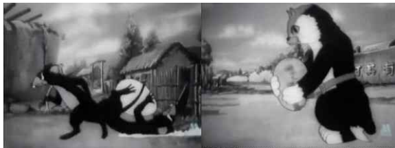
<그림 1> 계란을 훔치는 쥐 <그림 2> 계란을 지키는 고양이

상해 미술 영화 제작사(1950)에서 제작한 애니메이션 「고마워! 고양이」(謝謝小花貓)에는 인격화된 고양이 영웅 캐릭터가 등장한다. 애니메이션에 등장하는 이 고양이는 동물이라는 속성은 거의 없고 사회주의 경찰이라는 신분을 부여받는다. 이 고양이는 국민을 잘 지키는 좋은 고양이이며 순찰을 돌고 곡식을 지키며 집을 지킨다. 쥐가 곡물을 훔치고 사람들의 이익을 침해했을 때 고양이가 가장 먼저 나서서 쥐를 잡고 악당을 제거한다. 국민의 이익을 지키기 위하여 적들과 용감하게 싸우는 지혜로운 고양이는 이상적인 혁명영웅 이미지라고 할 수 있다. 사람들이 힘을 합쳐 쥐를 잡고 적을 소멸하는 결말은 용감하게 적과 맞서 싸우는 혁명정신을 보여주었을 뿐만 아니라 사람들이 단결하여 함께 싸워 이기게 되는 강력한 힘도 보여주고 있다.