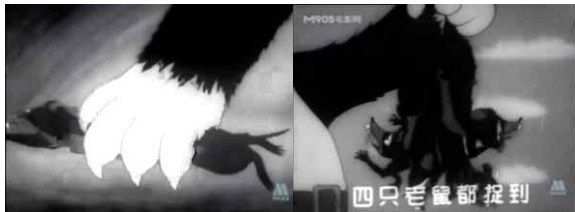
<그림 3> 고양이가 쥐를 잡다 <그림 4> 쥐를 잡다

「마량의 신비한 붓」(神筆馬良, 1955)에 등장하는 주인공 마량은 중국 신화 이야기를 차용하여 만든 혁명영웅 캐릭터이다. 마량에게는 신비한 붓이 하나 있다. 마량은 이 붓으로 하층민들의 어려움을 해결해주고 그들을 위해 좋은 일을 많이 하였다. 그는 또 이 붓으로 관료계급과 맞서 싸운다. 애니메이션은 신비한 붓을 차지하기 위한 다툼을 중심으로 스토리를 구성하였으며 그 과정에서 관리와 농민 사이의 투쟁과 대립관계를 표현하였을 뿐만 아니라, 마량이 개인의 안전은 무시한 채 다른 사람을 구하려고 하는 용기도 집중적으로 조