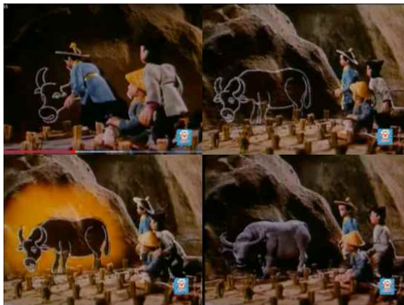
<그림 5> 「마량의 신비한 붓」: 소 그림이 진짜 소가 되다

예를 들면, 「마량의 신비한 붓」(神筆馬良, 1955년)의 주인공 마량에게는 신비한 붓이 있는데, 이 붓으로 그린 모든 사물은 실제 사물로 변할 수 있다. 관리들이 마을 사람들의 양을 빼앗자 마량은 이 붓으로 양을 그려 그들에게 보상을 해주었으며 마을의 한 노인이 눈밭을 경작할 힘이 없자 마량은 붓으로 그에게 소를 그려주었다. 관리들이 그의 붓을 빼앗으려고 할 때 이 신비한 붓은 오히려 그들과 맞서 싸우는 강력한 무기가 되었다. 이 애니메이션에서 '신비한 붓'은 계급적 성격을 띠고 있다. 마량이 국민을 위해 그림을 그릴 때는 붓이 신기한 힘을 발휘하고, 탐욕스러운 관리들이 이 붓으로 금산을 얻으려고 하자 아무 것도 그려지지 않았다. 애니메이션 창작자는 '기이한 스토리'를 통해 계급적 입장과 혁명에 대한 추구를 보여주었으며, 또 애니메이션의 내용과 아름다운 세상을 갈망하는 사람들의 소망을 연결시켜 표현하였다.