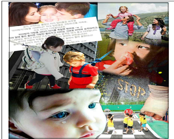
[그림 1] 한국형 미아방지가방 아이디어 이미지맵

실종 및 안전사고 예방을 위한 한국형 미아방지 가방은 ‘별 탈 없이 건강하게 잘 자라나라’ 라는 의미로 ‘Dodam Dodam’ 으로 하여 양육자와 영유아가 행복한 제품이 되도록 구현하고자 하였다. 이미지맵은 한국형 미아방지 가방 아이디어 이미지맵과 패션 가방으로서 디자인 주제 선정 이미지맵을 구성하였다. 이는 그림 1, 2와 같다.