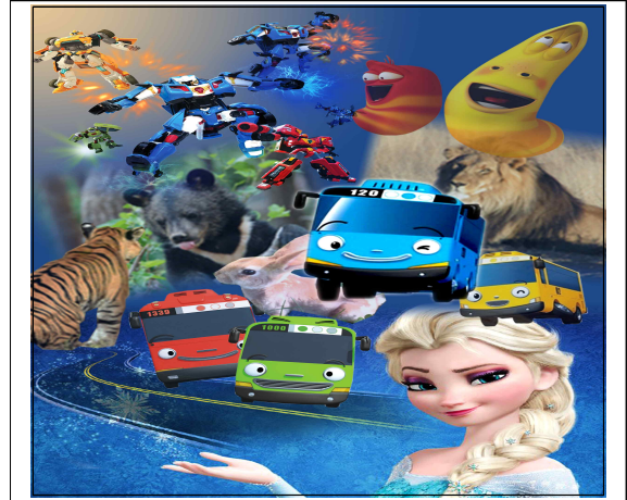
[그림 2] 디자인주제 선정 이미지맵