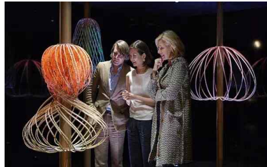
[그림 8] 수정을 이용한 작품 <Sundew>