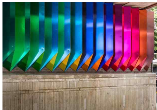
[그림 7] 창의적 배경의 설치미술