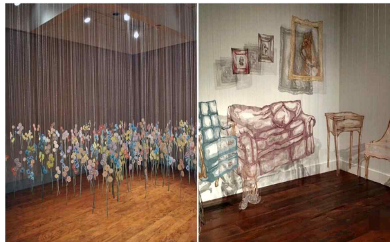
[그림 2] 입체 설치미술

섬유재료를 예로 입체 설치미술 형태를 설명하자면 부드럽다는 특징이 있다. 예술가들은 다양한 창작 기법을 통해 조소(彫塑)와 이차원 공간을 융합시켜 입체적인 설치미술을 연출한다. 편직(編織) 조소 방식은 설치미술 공간 시각효과를 한층 더 끌어올려 감상자의 감성을 자연스럽게 유도한다. 다음은 선(線)과 봉제(縫製)를 이용해 탄생된 설치미술로, 선(線)만의 고유한 특징을 체험함으로써 신체와 섬유 간의 관계를 탐구하고자 한다. 2)