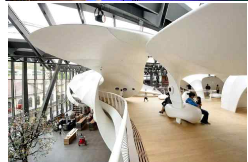
[그림 5] 실내 설치미술