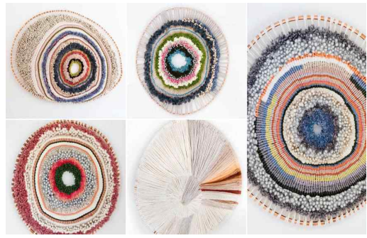
[그림 1] 평면 설치미술

방직(紡織) 재료를 설치미술에 십분(十分) 활용하여 창작공예 기법에 대해 비교 및 재조합을 진행하였다. 평면 설치미술에서 직감적(直感的)으로 창작된 평형 설치디자인은 주변의 환경에 시각적 영향을 준다. 이러한 형태의 설치미술은 일상에 생동감을 불어넣는데, 이를 벽에 걸어 전시하면 마치 자연계에 존재하는 여러 유기(有機) 형태처럼 보인다. 오색찬란(五色燦爛)한 설치 작품은 방직이 생성해내는 디테일한 매력을 대표하고 주변 공간 환경의 아름다움을 공유한다. 1)