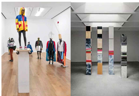
[그림 3] 정적 설치미술

작품의 창작 방식을 조립, 조소 등 관련성이 없는 요소와 결합하였고, 이러한 추상적이고 독특한 설치미술은 주변 사람, 공간, 건축과의 관계를 나타낸다. 작품은 적당한 범위를 유지하면서 관중들의 심리적 공감대를 형성하고 사고(思考)하는 데 도움을 준다.