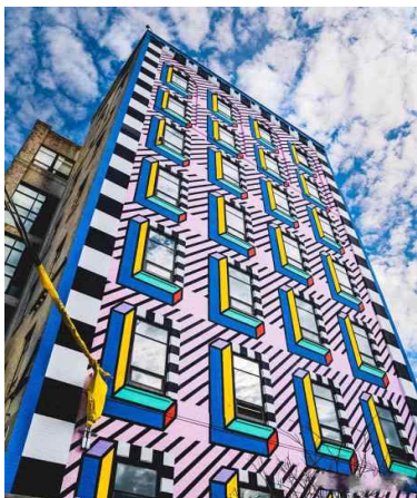
[그림 6] 실외 설치미술