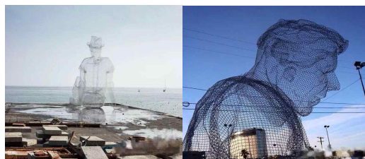
[그림 4] 동적 설치미술

동적 설치미술은 지대한 지역성과 시효성(時效性)을 가진다. 작품 자체는 햇빛, 현대 과학 기술, 인공지능, 기타 외부 요소의 영향을 받아 동적 효과를 나타내고 이에 관중들은 작품에 큰 관심을 가지게 된다. 예를 들어, 철조망 조각을 주재료로 사용하여 인간의 형상을 본뜬 작품에서도 몸짓과 감정 간의 관계를 표현할 수 있을 뿐만 아니라 차가운 느낌의 금속 재료로도 인간의 동작과 정서를 표현해낼 수 있다. 작품의 형태는 마치 동결(凍結)된 사람처럼 서로 다른 시간과 햇빛 등의 요소를 통해 마치 작품 자체가 직접 얘기하고 감정을 전달할 수 있는 것처럼 느껴지게 한다. 그물형 인물 조각품은 공간과 매우 잘 어우러지고 인물의 얼굴 방향을 제각기 다르게 설정함으로써 관중과 공간 및 조각 간의 스토리를 생성하고 설치 미술과 사람 간의 상호작용을 형성한다.