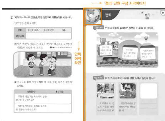
[Fig. 2] 2015 개정교육과정 국어 2-1(나) 11단원 '정리 학습' 페이지 레이아웃

로형 라인을 배치하고 ‘정리’ 단원 구성 시각이 미지 부분과 연결한 경계라인을 기준으로 독립된 페이지라는 느낌을 강조하고 있다.