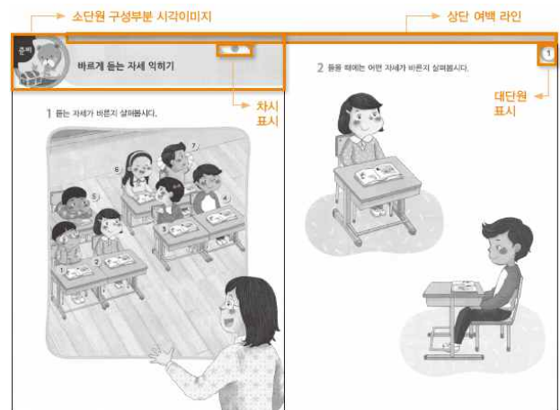
[Fig. 1] 2015 개정교육과정 국어 1-1(가) 1단원 ‘준비학습’ 페이지 레이아웃

2015년 개정교육과정은 학기별로 구분하여 2권의 국어교과서와 1권의 국어활동 교과서로 구성하고, 국어활동 교과서의 단원 구성은 ‘기본학습 다지기’, ‘기초다지기’ 소단원과 ‘글씨 쓰기’ 학습으로 되어 있다.