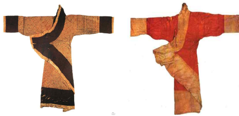
[Fig. 1] 호남성 박물관 심의 문물 http://61.187.53.122/list.aspx?id=19&lang=zh-CN&page=3

치파오는 포복(袍服)의 일종에 속한다. 포복은 춘추전국시대(기원전 770년-기원전 222년) 심의(深衣)에서 비롯되었다. 심의는 [Fig. 1] 중국 고대인들이 입던 상의와 하상이 하나로 합쳐진 상복이다.