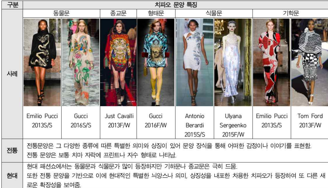
[Table 8] 치파오 문양 특징 (www.vogue.com 검색일2019.03.15.-2019.03.20.)

이는 중국 전통 치파오 요소와 서양 문양이 어우러진 것으로, 전통과 현대의 요소가 충돌하면서 오는 의외성의 미학을 보여주며 해당 디자인 작품이 새로운 오리엔탈리즘의 한 방향성을 보여주는 계기가 되었다[Table 8]. 이렇게 문양을 통한 확장은 동양디자인과 서양디자인의 융합뿐만 아니라 서양디자이너들의 동양전통문화에 대한 확장성 있는 디자인을 대표한다[Fig. 6].