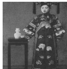
[Fig. 2] 국립박물관 청나라 치파오 http://114.255.205.160/?TabId=212&AntiqueLanguageID=6416

가 본토 문화와 융합하면서 잠재적인 변혁이 시작되었는데, 특히 1930년대와 40년대는 중국 치파오의 황금시대이자 근대 중국의 여성복이 가장 찬란한 시기였다. 6) 예를 들어 칼라의 높낮이, 소매의 짧은 길이, 트임의 높은 키가 모두 변화하였다. 이 시대에 치파오는 기존의 낡은 스타일에서 탈피하여, 현대에서 볼 수 있는 치파오 특유의 여성의 S라인을 유감없이 살리는 디자인으로 자리잡게 되었다.