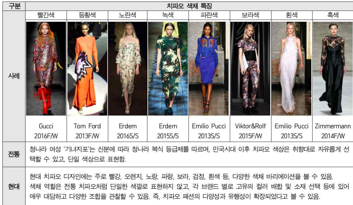
[Table 7] 치파오 색채 특징 (www.vogue.com 검색일2019.03.15.-2019.03.20.)

조가 매우 선명하다. 또한, 이와는 대조적으로 무채색 계열 색채의 애플리케이션인 검은색과 흰색이 조합이 다양하게 등장했다. 이렇듯 고풍화도 색상과 무채색계 색상의 적용은 색상 설계에 있어 완전히 양극단의 방향성으로, 서양 디자이너들은 현대 치파오의 전통 치파오 문화에 대한 새로운 해석이 이러한 양극화된 표현으로 시도되고 있다는 것을 볼 수 있다 [Table 7].