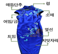
[Fig. 4]치파오의 구성 https://mobile.zcool.com.cn/work/ZMjixMjc5NDA=.html

치파오는 여밈/금(开襟), 령(领), 소매(袖), 치맛자락(裙摆), 트임(开衩), 옆선(滚边), 매듭단추(盘扣)로 구성되어 있다. 전통 치파오 디자인에 나타난 여밈, 령, 소매, 치마자락, 매듭단추는 다음의 [Table 2] 7) 및 [Fig. 4]과 같다.