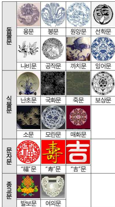
[Table 3] 전통 치파오 문양 종류 (www.baidu.com) 검색일 2019.03.15.-2019.03.20)

미한다. 종교문은 주로 팔보문(八宝纹), 여의문(如意纹)을 대표하여 부귀(富贵), 평안(平安), 길상(吉祥)을 의미한다. 산수 문양의 치파오는 비교적 보기 드문 독특한 문양의 제식이다. 산수문은 주로 산수, 전원 풍경을 대표하여 대자연의 풍광과 중국 고대 전설 고사를 표현한다. 기하학적 문양은 대부분 두 방향으로 연속된 기하 도안으로, 사람들에게 신선하고 우아한 느낌을 준다. 기하문은 주로 원형, 정사각형, 삼각형, 선을 통해 분산되고 집합적으로 재결합되는 도형문양이다.