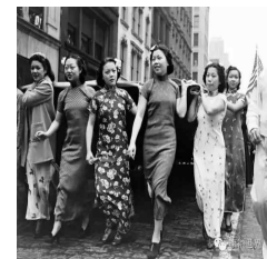
[Fig. 3] '해파' 치파오