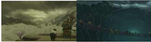
<그림 17> 재난

영화 속 ‘춘(椿)’은 이미 일정한 ‘자주의식’을 가지고 있어서 더 이상 남성의 심미에 영합하려는 자기 욕망을 숨기지 않는다. 그러나 제작자는 ‘춘’이라는 여성 캐릭터를 만들면서 그녀의 ‘자주의식’을 공동체의 이익을 희생시키는 토대 위에 세웠다. 이런 창작 패턴은 창작자의 ‘유아 개인주의’ 가치 취향을 반영한다. 이런 패턴에서 여성의 이미지가 제대로 전달되지 않으며, 긍정적인 여성의 ‘미’가 왜곡되어 그려지고 있다.