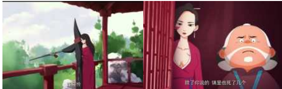
<그림 13> ‘차이’와 ‘튀단’