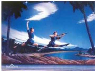
<그림 6> 모범극 <붉은 남자군>의 여군

1978년 '개혁개방' 이후 중국은 전통적 계획경제시대에서 시장경제 시대로 변화된다. 이는 몇천 년간 이어온 익숙한 농경 생활방식과 전통적인 윤리 질서의 해체를 의미하면서 이제 중국은 현대적 공업사회로 빠르게 전환된다. 하지만 '신문화운동' 시기의 '현대적' 혁신이 사회 변혁과정속에서 중단됨에 따라 중국 사회는 안정적인 '현대적' 사상의 기반을 마련하지 못한 상태에서 시장경제체제로 이양된다. 따라서 이전 시대의 전근대적 가치관의 영향력에서 벗어나지 못한 체 현대화 과정에서 나타나는 물질생활과 정신생활