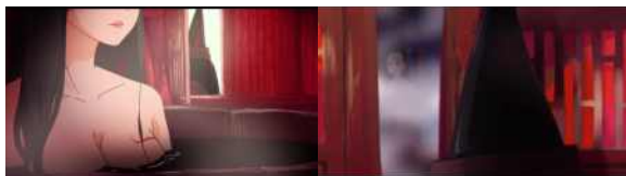
<그림 11> ‘섹시한’ ‘차이’

상품화된 여성심미 패턴은 애니메이션 창작에서도 나타난다. 2017년, 개봉한 <대호법, 大护法>에서 등장하는 대부분의 캐릭터는 ‘땅콩’의 이미지로 표현되고 있으며, 오직 주요 캐릭터만이 독립적인 면모(面貌)를 가진다. 이처럼 독립적인 면모를 가지고 있는 캐릭터 중에서 ‘차이(彩)’가 지닌 ‘요염함’, ‘섹시함’의 이미지가 특히 더 대중들의 시선을 사로잡고 있다. 영화에서는 ‘차이(彩)’가 등장할 때마다 남성이 따라서 나타난다. 그녀는 단지 하나의 ‘서브 역할’로서, 남성의 뒤에 존재한다. ‘차이’는 자신을 말할 틈도 주지 않고 마치 주체성을 상실한 ‘부속품’처럼 모든 역할을 남자들한테만 맡겨야 하고 남성의 엿보기와 통제에 저항할 능력이 없다.