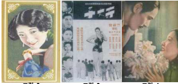
<그림 2> '영미 담배' 여성 초상 영화 '기여자' 포스터 영화 '신여성, 포스터'

1949년 신중국 성립 이후 공산주의 사상의 지도 하에 '프롤레타리아 혁명' 과 '사회경제적 생산' 이 국가의 현안이 됨에 따라, '신문화운동' 이 요구하는 '현대성' 은 중단되게 된다. 전 국민이 혁명과 노동에 적극적으로 참여하는 분위기 속에서 '남녀평등' 이 다시 거론되며 헌법의 정관에 포함된다. 이러한 정치적 분위기의 영향 하에 중국 남성들은 더 이상 '현대성' 을 여성의 심미적 기준으로 삼지 않게 되고, '노동미' 와 '전투미' 가 제창된다. 이러한 심미적 욕구는 문화대혁명 시기까지 이어지면서 당시의 혁명 모범극에서 보이듯 여성의 이미지는 대부분 남성화된 여성 영웅의 이미지로 그려졌으며, 노동에 적극적으로 참여하는 여성의 이미지가 모범적인 것으로 여겨졌다.