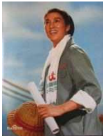
<그림 5> 모범극 <해항>의 여주인공

1949년 신중국 성립 이후 공산주의 사상의 지도 하에 '프롤레타리아 혁명' 과 '사회경제적 생산' 이 국가의 현안이 됨에 따라, '신문화운동' 이 요구하는 '현대성' 은 중단되게 된다. 전 국민이 혁명과 노동에 적극적으로 참여하는 분위기 속에서 '남녀평등' 이 다시 거론되며 헌법의 정관에 포함된다. 이러한 정치적 분위기의 영향 하에 중국 남성들은 더 이상 '현대성' 을 여성의 심미적 기준으로 삼지 않게 되고, '노동미' 와 '전투미' 가 제창된다. 이러한 심미적 욕구는 문화대혁명 시기까지 이어지면서 당시의 혁명 모범극에서 보이듯 여성의 이미지는 대부분 남성화된 여성 영웅의 이미지로 그려졌으며, 노동에 적극적으로 참여하는 여성의 이미지가 모범적인 것으로 여겨졌다.