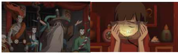
<그림 15> '천명'의 발생자 <그림 16> '곤' 신계로 끌어들임

처럼 보이지만 실상은 그렇지 않다. 영화에서 ‘춘’의 ‘불순종’, ‘독립성’은 공적 책임을 포기하는 것을 전제로 한다. 그녀는 자신의 사욕을 위해 ‘인간과 접촉할 수 없다’는 ‘하늘의 명령’을 어기고 집단을 버리고 ‘재앙’을 일으켜 신계의 형제들에게 말려들어 목숨을 잃는다. 그녀의 이런 ‘불순종’, ‘독립적인 자주정신’은 자기중심적이고 개인의 욕망과 정서의 표현에만 신경을 쓰며 공동체의 이익을 무시하는 삶의 태도와 가치를 보인다. 이를 위해 엄청난 대가를 치르며, 결국 신계에서 살 자격을 상실한다.