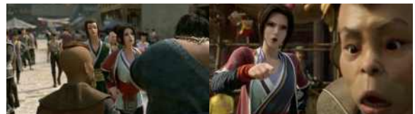
<그림 9> 아들을 대신해 곤란한 <그림 10> 건달과 싸움을 벌이는 상황을 해결해 주는 ‘메이’ ‘메이’

하지만 이야기 후반에 이르러 ‘메이’는 연약한 모습을 보인다. 마을 전체가 적들의 공격으로 인해 멸망할 위기해 처한 상황에서 마을을 구했던 건 결국 ‘랑밍(朗明)’을 주축으로 한 남성들의 힘이었다. 즉, ‘용맹스러움’을 가진 ‘메이(梅姐)’도 결국 ‘랑밍’의 손길을 필요로 하는 한 여성일 뿐이라는 것이다. 바꾸어 말하면, 세계와 인류를 구원하는 대업을 완수함에 있어 ‘용맹스러운’ 여성 ‘메이’는 도움이 되지 못한다는 의미로 비춰진다. 이처럼 작품 속에 여전히 ‘남강여약(男强女弱)’의 전통 관념이 내재되어 있다는 것을 볼 수 있다.