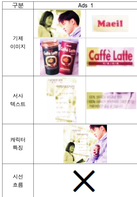
[Table 3] 2000년~2003년 커피광고 이미지