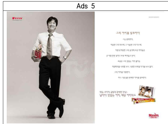
[Fig. 1] 2000년~2003년대 대표 커피 광고물

구체적으로 살펴보면, <Ads 1>에서는 두 명의 배우가 등장한다. 좌우 대칭이 되어 배치된 배우들과 상품이 중앙과 하단부에 위치하여 조화를 이룬다. 광고 이미지 정중앙과 중앙 위에는 커피가 위치되어 있고, 하단부에는 제품명이 표기되어 있다. 전체적 시선은 [X]자 흐름을 구성한다. 반면에 <Ads 2>와 <Ads 3>은 한 명의 배우가 등장한다. 광고 이미지 중앙을 기점으로 우측까지 이미지의 피사체가 위치되어 있고, 그 피사체 끝을 기점으로 하단에 상품을 배열해 놓았다. 좌측 상단에는 커피가 있고, 우측 상단에는 기업명이 있어서 좌우 상단배치가 균형을 이룬다. 하단부 좌측 하단의 상품을 둘러싸는 형태로 브랜드명과 슬로건들이 자리잡고 있다. 전체적 시선은 [∩]자 흐름을 구성한다. <Ads 4>는 3명의 배우가 등장한다. 광고 이미지를 4분할 해서 상단 양쪽과 하단 우측에 배우를 배치시켰고, 하단 좌측에는 상품을 위치시켜서 균형을 이루게 하였다. 뿐만 아니라 4분할 공간 각각의 우측 하단에 상품을 별도로 추가 배치하였는데, 7개의 여러 다른 상품을 모두 등장시켰다. 또한 각 4분할 공간내 위치된 상품의 주변으로 슬로건이 자리 잡고 있다. 기업명 역시 광고 이미지의 상단 좌측에 위치하고 있다. 전체적 시선은 [□]자 흐름을 구성한다. <Ads 5>는 스프레드(광고 이미지가 인쇄광고물 양면에 할애된 광고) 형태의 광고로서 좌측면에는 배우가 우측면에는 커피와 상품이 배치되어 있다. 우측면 상단에는 기업명이, 좌측면 하단에는 브랜드명이 있다. 전체적 시선은 [-]자 흐름을 구성한다.