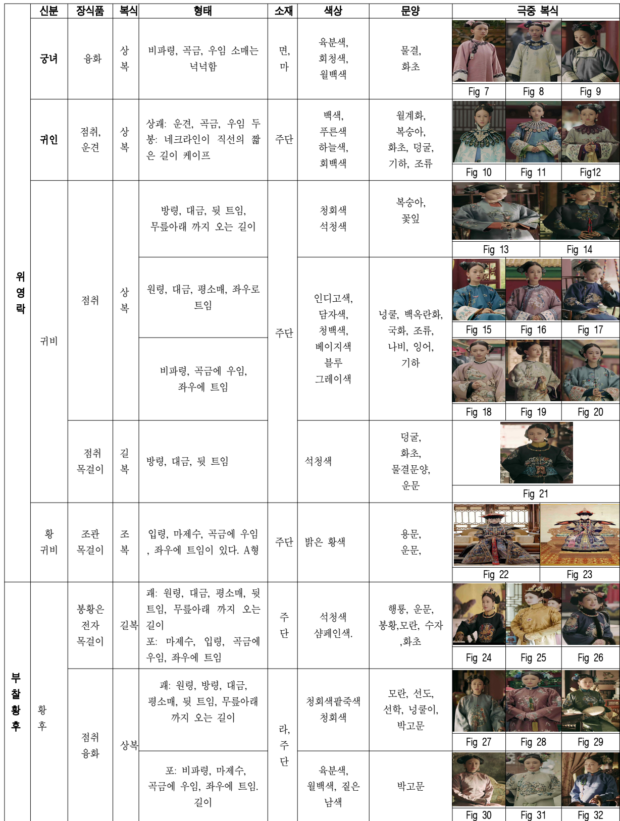
[Table2] 위영락과 부찰황후 극중 복식 분석