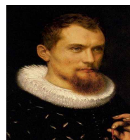
<그림 11> Celebrities in the Renaissance

르네상스 시대부터 직물산업의 발달이 가속화되어, 기계가 개량되고, 염색가공 기술이 발달하면서 새롭고 다양한 소재가 개발되었다. 복식의 소재는 단색의 벨벳이나 두 가지 이상 문양의 직물, 털 길이를 차이 나게 하는 번아웃(burn out) 효과를 표현한 직물, 자수를 놓은 것, 금·은사를 넣어 직조한 사치스러운 직물 등 그 종류가 매우 다양해졌다. 러프는 얇으면서 힘이 있는 고급 소재 린, 캔브릭, 또는 레이스를 단단하게 풀칠을 해서 다리미를 사용해 주름을 붙여가는 것이었다. 귀족들은 고급지를 사용하고 견 자수를 놓았으며 심지어 금, 은, 그 외 고가의 레이스로 장식하기까지 했다. 이와 같이 고급 소재의 개발은 러프 칼라의 장식성이 보다 더 확장되는 계기가 된다.