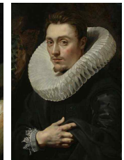
<그림 21> portrait of a young man