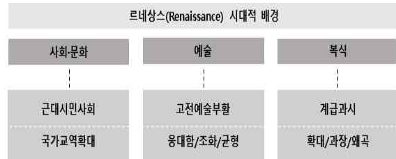
<그림 3> 르네상스(Renaissance) 시대적 배경

다. 본 장에서는 먼저 르네상스와 바로크 시대의 시대적 배경을 살펴본 후, 위의 세 가지 문화 구성요소를 바탕으로 르네상스와 바로크 시대를 비교 분석을 진행하였다.