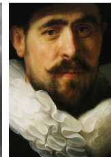
<그림 20> portrait of a Bearded man by Rembrandt