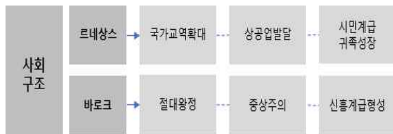
<그림 6> 르네상스, 바로크 문화구성요소 비교 - 사회구조

이처럼 각각의 다양한 정치체계에 의한 사회구조는 국가별 사회·문화·예술 면에서 고유한 특성이 대두되는 역할을 하였다.