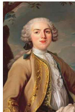
<그림 45> Louis XV en chasseur