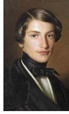
<그림 50> 1800s portrait of unknown man

이처럼 바로크 후기의 크라바트는 착용계급, 소재, 구조적 요소에서 당시 사회구조적, 기술, 이데올로기 등 문화 구성요소의 영향을 고루 받았음을 알 수 있다. 특히 기술발전은 형태의 다양함을 확대하였으며, 초기에는 왕족과 귀족들만의 향유였던 것이 차츰 사회구조의 변혁에 의해 착용계급의 범위가 넓어지고 있음을 확인할 수 있었다.