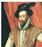
<그림 9> 렐리(Walter Raleigh)