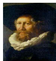
<그림 12> Portrait of a gentleman