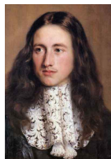
<그림 59> Portrait of Philippe, Duke of Vendome

또한, <그림 58>, <그림 59>와 같이 위그(가발; peruke) 32) 의 등장으로 인해 네크라인 장식이 복식의 앞 중심으로 이동하면서 크라바트의 폭과 길이의 다양한 표현이 가능해졌으며, 이는 예술적 조형미를 고조 시켰다. Hogarth 33) 는 크라바트를 '묵직한 주름은 우아함에 위대함을 더한다.'고 주장하였다. 이로 인해 크라바트 주름의 풍부한 양감과 태슬 장식을 통해 귀족적 권위를 조형적으로 나타내었다.