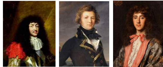
<그림 38> Portrait of Louis XIV <그림 39> Portrait of Philippe d'Orléans <그림 40> Portrait of gentleman

폴링 칼라는 당시 은행인·상인·법률가등 신홍계급의 성장과 함께 긴 가발이 성행하면서 사라지게 되었다. 대신 크라바트가 17세기 중반부터 루이 14세에 의해 왕실의 기장으로 채택되기 시작하면서 유행하게 되었다. 귀족계층이나 군인들은 목에 크라바트를 착용하여 ‘멋있음’을 과시하기 시작했으며, 이는 귀족 중심의 도시 사회로부터 시작되었다. 상류사회에서만 유행하던 크라바트는 매듭법의 간소화에 따라 1660년대부터 유행의 전유물이 되었다. 편리하게 앞에서 리본이나 매듭을 묶어서 매는 형식의 크라바트가 등장하게 되면서 남성 복식에 흰 칼라 대신 목 장식으로 사용되었으며, 후대에는 넥타이로 정착되었다. 23)