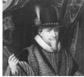
<그림 17> Portrait of prins Maurits Van Oranje

러프 칼라의 형태는 기본적으로 맞주름을 잡은 둥근 수레바퀴형 칼라이며, 원형, 하트형, 나비형, 부채살형 등 다양하였다.<그림 17> 르네상스 시대 재단기술의 발달을 통해 주름의 크기와 개수, 천의 종류에 따라 다양한 형태의 연출이 가능해졌다. 또한, 앞서 언급한 바 있듯이 상공업의 발달로 인한 신흥계급의 성장과 함께 신분과 직책의 차이에 따라 러프의 크기도 다양하게 만들었다. 또한 러프 주름의 두께는 기본 3인치 이상이었는데, 네크라인 위로 폭이 9인치나 높은 러프도 있었고, 카트 휠 러프 같은 경우 아래의 <그림 18>와 같이 목부터의 길이가 18인치나 되는 것도 있었다. 크기가 작은 것은 앞 중심이 갈라져 있고, 중간크기의 것은 막힌 둥근 형태이며 수레바퀴처럼 커다란 것은 가장자리에 서포타스(Supportasse)라 불리는 철사를 끼워 넣어 뻗치게 하여 형태를 유지하도록 하였다.