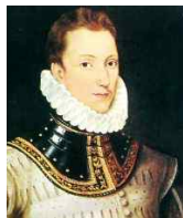
<그림 16> 필립 시드니(Philip Sidney), 런던 내셔널 포트레드 갤러리 소장

러프 칼라의 형태는 기본적으로 맞주름을 잡은 둥근 수레바퀴형 칼라이며, 원형, 하트형, 나비형, 부채살형 등 다양하였다.<그림 17> 르네상스 시대 재단기술의 발달을 통해 주름의 크기와 개수, 천의 종류에 따라 다양한 형태의 연출이 가능해졌다. 또한, 앞서 언급한 바 있듯이 상공업의 발달로 인한 신흥계급의 성장과 함께 신분과 직책의 차이에 따라 러프의 크기도 다양하게 만들었다. 또한 러프 주름의 두께는 기본 3인치 이상이었는데, 네크라인 위로 폭이 9인치나 높은 러프도 있었고, 카트 휠 러프 같은 경우 아래의 <그림 18>와 같이 목부터의 길이가 18인치나 되는 것도 있었다. 크기가 작은 것은 앞 중심이 갈라져 있고, 중간크기의 것은 막힌 둥근 형태이며 수레바퀴처럼 커다란 것은 가장자리에 서포타스(Supportasse)라 불리는 철사를 끼워 넣어 뻗치게 하여 형태를 유지하도록 하였다.