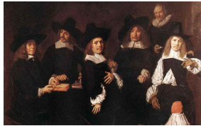
<그림 23> Portrait of The Regents of the Old Men's Almshouse Haarlem

폴링 칼라는 1615년경부터 1670년 사이에 유행하였다. 슬래시가 유행하게 되면서 슬래시 안에 하얀 셔츠와 함께 착용하였으며, 작게 세운 스탠드 칼라(stand collar)에 커다란 레이스의 폴링 칼라(falling collar)를 덧붙였다. 때문에 폴링밴드 칼라(Falling band collar)라고도 불렀다. 20)