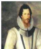
<그림 15> 에섹스 백작(Robert Devereux, 2nd Earl of Essex)의 초상