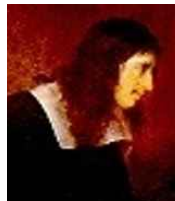
<그림 27> Portrait of The Suitor's Visit

바로크 시대의 복식은 프랑스의 절대왕정의 절대적인 영향을 받았으며, 이와 동시에 경제적 부국인 영국과 네덜란드의 영향을 많이 받았다. 따라서 복식도 절대왕정의 상징으로 장엄하고 화려한 복식과 동시에 서민복도 함께 성장하게 되었다. 특히 초기 바로크의 유행을 주도했던 네덜란드의 정치 체제는 공화연방제였고, 종교개혁의 영향으로 복식문화의 주체가 귀족 계층이 아닌 일반 시민이었다. 또한, 17세기 초반 은행가·상인·법률가 등의 신흥계급들이 등장하였고, 그들의 복장은 귀족풍보다 시