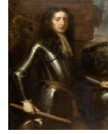
<그림 55> James Stewart the black knight

크라바트의 길이나 폭, 매듭법에 의한 구조의 다양성은 왕족, 귀족, 법률가, 은행가, 서민 등의 계급 이해 수단으로도 작용하였다. 이처럼 바로크 시대 국가들은 외교적으로 과시하기 위한 목적으로 문화예술에 치중하기도 하였다. 그런 흐름을 이어받아 절대왕정 시기에는 예술과 복식이라는 도구를 통해 왕의 위엄을 감동적으로 보여주려는 시도가 적극적으로 모색되었다. 이처럼 복식은 권력을 나타내고 사회적 지위 및 부를 표현하는 표식으로 사용되었다. 어느 시대나 복식에 의해 권력이나 부를 나타낼 때에 소재, 형태, 구조에 의해 변화를 주었으며 29) , 이를 초상화로 남겨 타인을 위압하고 존엄성을 발휘하도록 화려함과 정교함으로 위엄과 권력을 나타내었다. 계급사회에 들어와서는 정치적 역할이 더해져서 복식은 계급이나 계층의 상징이 되었다. 30)