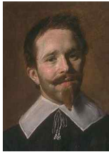
<그림 56> Portrait of an Unknown man

바로크 시대 초기 폴링칼라, 후기 크라바트의 외형 분석으로 확인할 수 있는 조형적 심미는 형태 및 구조의 '우아함'이다. 바로크 시대 초기 폴링칼라는 대칭과 뻗어나가는 동적인 특성을 보인다. 폴링 칼라의 기본 형태는 직선 위주의 전체 형태였으나, 내부 장식들의 곡선적 배치, 폴링칼라 밑단의 물 흐르는 듯한 율동적인 부드러운 동적 이미지는 우아함을 보이고 있다.