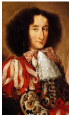
<그림 44> Portrait of Charles IV