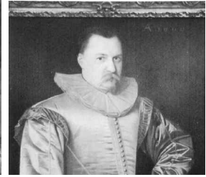
<그림 18> Portrait of Gentleman in Renaissance

러프칼라의 구조는 <그림 19>와 같이 목둘레 위로 1.5배 정도의 덧단을 제작하여 턱선 위로 셔링을 주어 퍼지도록 밴드칼라 형식과 흡사하다. 여기에 목둘레에 금, 은, 또는 견사로 두른 철사를 둘러서 러프가 떨어지거나 엇갈려 밀으므로 쳐지지 않고 지탱하도록 하였다. 앞 중심부터 철사 테두리를 넣어 끈으로 목에 맬 수 있도록 되어 있었으며, 주름구조는 <그림 20>처럼 횡으로 잡아 장식하거나 <그림 21>처럼 종으로 처리하여 제작하였다.