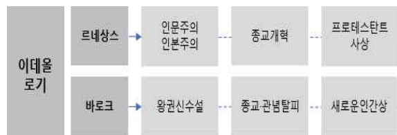
<그림 7> 르네상스, 바로크 문화구성요소 비교 - 이데올로기

바로크 시대는 왕권신수설을 바탕으로 절대주의 궁정과 기독교의 권위를 세우려는 반종교개혁의 정신을 모태로 나타난 양식이 전 유럽에 퍼졌다. 종교·관념으로부터 탈피한 양식으로써 인간을 '표현'하는 단계에 이르게 되었다. 이는 새로운 인간 정신의 표현 양식인 '형태'의 양식으로 설명된다. 또한 르네상스 휴머니즘의 근간을 이루었던 '이성'이 몽테뉴의 회의주의로 인해 실추되었으며, 데카르트 17) 에 이르러 '방법적인 회의'(doute méthodique)라는 과정을 거치면서 '나'는 곧 '생각하는 실체(res cogito ergo sum)'로서의 '나'가 된다는 명제를 끌어내어 사유하는 주체로서의 새로운 인간상이 제시되기도 하였다 18) . 이와 같이 르네상스와 바로크 시대는 문화 구성요소의 상위구조인 이데올로기의 확립으로 이전과 다른 독자적 세계를 추구하였다.