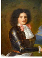
<그림 41> portrait of young Louis de Bourbon

스 등의 소재를 사용하였다. 신혼 계층들의 크라바트와는 달리, 절대왕정 시기 왕가의 크라바트 소재는 <그림 41>의 초상화에서 볼 수 있듯이 플라드르와 베니스의 최고급 레이스 소재들만 사용하여 제작하였다.