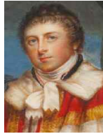
<그림 42> 180px-5th duke of bedford