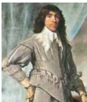
<그림 25> Portrait of Hamilton