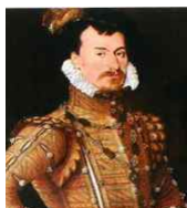
<그림 8> 로버트 더블리 경 초상