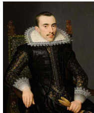
<그림 53> Portret van een man

바로크 후기, 절대왕정 시기에는 왕권을 감각적인 이미지로 표상화 하려는 시도에 중점을 두었다. 이러한 이유로 절대왕정은 사람들에게 감동을 주는 시각적인 보임세에 치중했으며, 이를 실현하기 위해 건축과 더불어 복식은 적절한 수단이 되었다. 귀족들 또한 자신들의 지위를 과시하기 위한 방법으로 왕정에서 착용하던 가발을 착용하기 시작하였으며, 머리가 길어짐에 따라 바로크 시대 초기에 유행하던 폴링 칼라 대신 루이 14세 시대부터 크라바트를 착용하기 시작하였다.