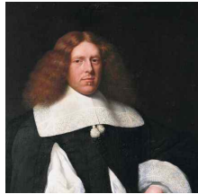
<그림 57> Jan Albertsz. Rotius, Portrait of a 33-year-old man

후기 크라바트의 조형미는 주름이 주는 자유로운 움직임과 비대칭으로 해석할 수 있다. 이 시기의 소재는 대체로 흐르는 곡선의 실루엣을 보여주는 리본, 레이스, 프릴 등의 과다한 장식들을 통한 율동적인 실루엣 표현이 가능한 소재였다. 크라바트는 루이 14세에 의해 왕가의 표식으로 사용되어 일반 계급과의 차별을 두었으며, 그 형태의 실루엣과 조형미는 웅장하고 기품 있었다.