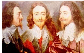
<그림 24> Anthony van Dyck, Charles I