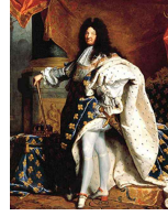
<그림 54> Portrait of Louis XIV

바로크 후기, 절대왕정 시기에는 왕권을 감각적인 이미지로 표상화 하려는 시도에 중점을 두었다. 이러한 이유로 절대왕정은 사람들에게 감동을 주는 시각적인 보임세에 치중했으며, 이를 실현하기 위해 건축과 더불어 복식은 적절한 수단이 되었다. 귀족들 또한 자신들의 지위를 과시하기 위한 방법으로 왕정에서 착용하던 가발을 착용하기 시작하였으며, 머리가 길어짐에 따라 바로크 시대 초기에 유행하던 폴링 칼라 대신 루이 14세 시대부터 크라바트를 착용하기 시작하였다.