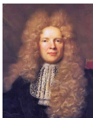
<그림 58> Portrait of Lambert de Vermont

후기 크라바트의 조형미는 주름이 주는 자유로운 움직임과 비대칭으로 해석할 수 있다. 이 시기의 소재는 대체로 흐르는 곡선의 실루엣을 보여주는 리본, 레이스, 프릴 등의 과다한 장식들을 통한 율동적인 실루엣 표현이 가능한 소재였다. 크라바트는 루이 14세에 의해 왕가의 표식으로 사용되어 일반 계급과의 차별을 두었으며, 그 형태의 실루엣과 조형미는 웅장하고 기품 있었다.