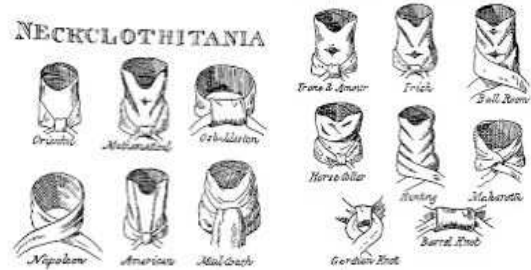
<그림 47> 크라바트(Cravatte)의 구조

는데 전쟁터부터 우연히 시작되어 유행하게 된 것으로 크라바트를 정교하게 리본을 이용해서 묶는 것이 아니라 두 가닥을 두세 번 꼬아서 쥐스또꼬르의 단춧구멍에 집어넣어 묶는 방식이다. 26)