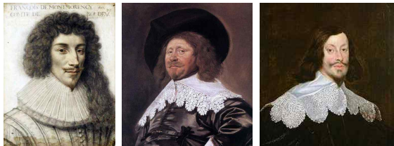
<그림 34> portrait of Francois de Montmorency <그림 35> portrait of a man <그림 36> Portrait de Ferdinand III par Frans Luycx

라 <그림 31>처럼 뾰뾰함을 유지하던 형태에서 차츰 턱선과 어깨선으로 내려갈수록 넓어지는 <그림 32>와 같은 형태의 칼라로 변화하였다. 또한, 플랫 칼라 등의 목을 감싸거나 어깨를 감싸는 넓은 형태의 목 장식을 하였다. 이후 중기에는 은행자본가, 법률가 등의 신홍계층을 위시로 가발이 유행하였고, 머리가 길어짐에 따라 <그림 33>과 같이 옆으로 넓은 칼라가 아닌 앞으로 길게 내리는 칼라가 차츰 등장하였다 21) . 후기 바로크 시대에 들어 폴링 칼라는 사라지고 현대 넥타이의 기원이 된 크라바트가 유행하게 되었다.