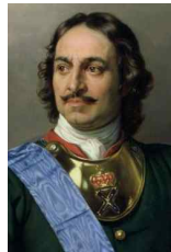
<그림 46> Peter der-Grosse

초기의 크라바트는 <그림 44>처럼 긴 레이스 천을 리본을 이용해서 목에서 묶어주는 형태였다. 이후에 스타인커크(steinkirk) 25) 가 등장하였