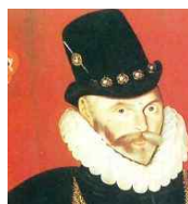
<그림 10> 제독 존 호킨스 (John Hawkins)

러프 칼라의 유행은 1580년대의 전성기를 지나면서 왕족, 귀족들의 사치와 권위의 상징으로 르네상스의 절정기를 장식했으며, 이는 서민층에까지 영향을 미쳤다. 특히, 이 시기 상공업 발달로 부를 축적한 신흥계급이 형성되었고,