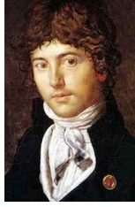
<그림 49> Bernier by Ingres