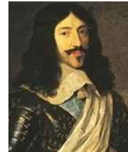
<그림 33> Luis XIII