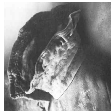
<그림 19> 러프 칼라(Ruff Collar)의 구조

러프칼라의 구조는 <그림 19>와 같이 목둘레 위로 1.5배 정도의 덧단을 제작하여 턱선 위로 셔링을 주어 퍼지도록 밴드칼라 형식과 흡사하다. 여기에 목둘레에 금, 은, 또는 견사로 두른 철사를 둘러서 러프가 떨어지거나 엇갈려 밀으므로 쳐지지 않고 지탱하도록 하였다. 앞 중심부터 철사 테두리를 넣어 끈으로 목에 맬 수 있도록 되어 있었으며, 주름구조는 <그림 20>처럼 횡으로 잡아 장식하거나 <그림 21>처럼 종으로 처리하여 제작하였다.