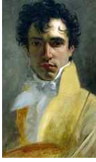
<그림 48> 1800s portrait of unknown man