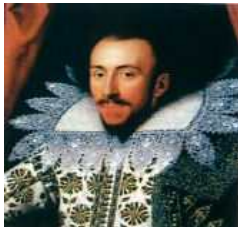
<그림 52> Richard Sackville

바로크시대 전기의 유럽은 종교개혁의 영향으로 하나의 '왕'을 중심으로 한 통일된 중앙집권국가체제로 전환되었다. 이에 따라 '왕권신수설'을 기반으로 국가전체주의가 도래했으며 이는 절대왕정의 출현을 야기하였다. 이러한 절대왕정의 왕들은 자신들의 위대함과 위엄을 과시하기 위해 복식에 그들의 권위를 나타내기 시작하였다. 또한, 왕 뿐만 아니라 국가의 도시계획의 결과로 도시중심의 귀족문화가 확산되기 시작하면서 귀족들의 권위 과시를 위한 다양한 형태의 네크라인의 변화가 나타났다. 바로크 초기의 남성복 네크라인은 러플이 일정 시기동안 유지되다가 좁은 폭의 스탠드 칼라에 뾰족한 소재의 휘스크 칼라가 등장하였다. <그림 52>