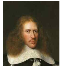
<그림 30> Datering volgens opgave cat. Westfries Museum