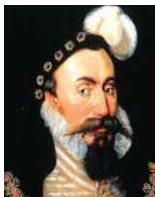
<그림 14> 로버트 더들리 (Robert Dudley, 1st Earl of Leicester)