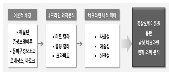
<그림 1> 남성 네크라인 변화 연구 흐름도