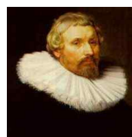
<그림 13> A portrait of a man 1

이후 <그림 12>처럼 러프의 크기가 커지고 <그림 13>의 카트 휠 러프(Cart Wheel Ruff) 같이 커다란 러프 칼라가 유행하게 되면서 두께는 얇지만 가늘게 깎은 나무나 두꺼운 종이를 심으로 말아 어깨에 올려 붙이기도 하였다. 초기에는 비에 젖거나 바람에 의해 형태가 틀