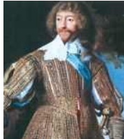
<그림 26> Portrait of Henry Rich