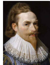
<그림 32> Nathaniel Bacon - Sir Nathaniel Bacon