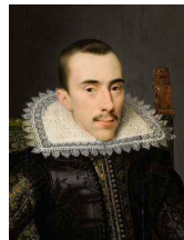
<그림 31> Portret van een man