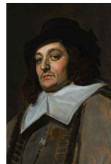
<그림 28> De reiziger Frans Hals

이 시기의 절대왕정 국가는 자신들의 위대함·위엄을 과시하기 위한 수단으로 소재의 고급화를 통한 장식성 강화에 치중하였다. 신흥계층 또한 본인들의 지위를 강조를 위해 고급스러운 소재를 사용한 칼라를 착용하였다. 왕가의 권세를 과시하기 위해 의복과 장신구 등 사물을 미화하여 제작하였으며, 과한 형태미를 적용하여 장식성을 극도로 강화하였다. 또한 르네상스 시대부터 이어진 직물 및 소재, 재단 기술이 현저히 발전하게 되었다. 이에 따라 초기의 폴링 칼라는 <그림 28>의 마지막물, <그림 29>의 레이스 등의 부드러운 소재를 사용하였으며, 반 다이크 칼라는 <그림 30>와 같이 고급스러운 레이스에 자수를 놓은 소재를 이용하였다. 이처럼 소재에서도 기술적인 측면과 사회구조적인 면이 동시에 연관되어 있음을 알 수 있다.