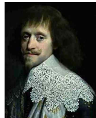
<그림 29> Portrait of a Gentleman