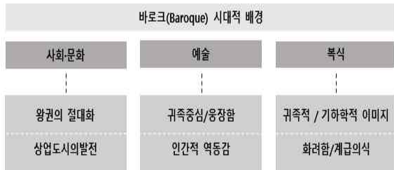
<그림 4> 바로크(Baroque) 시대적 배경

17세기 바로크(Baroque) 시대의 유럽 각국은 광대한 국토를 바탕으로 국제적 상업도시가 발달하였다. 또한, 프랑스 왕권이 절대화 되었는데, 이는 복식 문화에 결정적인 역할을 했다. 왕권의 절대화란 국왕의 절대적인 존재를 국가적으로 범령화한 것을 일컫는다 10) . 프랑스의 루이 14세는 ‘태양왕’이라 불리며 ‘왕권신수설’을 주장하였으며, 그 누구도 넘보지 못할 절대 권력을 누렸다. 따라서 당시의 궁전의 규모는 장대했으며, 왕의 위대함과 권력을 상징화 하였다. 또한 귀족중심의 예술 활동이 활발하였다. 이에, 이 시기의 예술품들, 특히 조각 분야에서 인간의 근육미와 역동성을 나타내는 사례들이 많았으며, 르네상스 시대의 예술과 비교하여 보았을 때에 화려함이 가미되었다. 이에 따라 바로크 시대의 복식 또한 귀족 중심이었으며, 기하학적 이미지의 화려함과 각자의 신분을 나타내는 계급의식이 뚜렷하였음을 알 수 있었다.