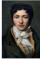
<그림 43> portrait of Unknown Man

이는 1605년부터 시행된 '폴레트세' 24) 에 의한 계층 간의 구분이 없어질 것에 대한 우려를 불식시키기 위한 소재 적용의 측면으로도 해석된다. 이처럼 바로크 후기 절대왕정이 극에 달했던 시기에는 크라바트의 소재나 구조에 의해 계급을 구분하기도 하였다. 귀족들은 레이스, 머슬린 또는 모시로 만들어 착용하였으며, 18세기 들어서는 서민층의 소재로 사용되기도 하였다.