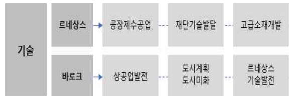
<그림 5> 르네상스, 바로크 문화구성요소 비교 - 기술

바로크 시대는 상업도시별로 다양한 상공업이 발전하였으며, 그에 따라 국가별 부가 축적되었다. 국가는 통치의 목적으로 도시계획과 도시미화를 시행하였고, 이로 인해 도시중심의 귀족문화가 형성되었다. 특히 르네상스 시대부터 이어진 기술이 발전하여 예술·경제·문화의 황금기를 이루었는데, 이와 더불어 고급 소재 개발로 인한 복식의 다양한 양식을 확립하였다. 이처럼 기술은 복식 양식의 발전에 중요한 요소로 작용함을 알 수 있다.