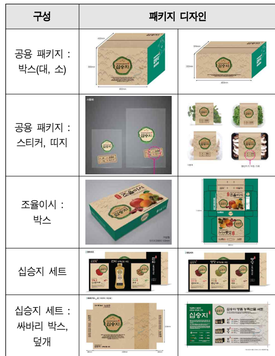
[Table. 12] 패키지 디자인 제작

개발된 심승지 브랜드 로고타입과 친환경농산물 꾸러미 상품 공동마케팅환경 분석 결과를 통한 심승지 공동브랜드 패키지 디자인을 진행하였으며, 꾸러미 상품의 5가지 분류[Table. 11]에 따라 그 특징에 맞는 패키지 디자인을 진행하였다. 심승지 공동브랜드 상품 개발 전략 및 환경 연구결과를 활용하고 기존의 로고 타입과 함께 그래픽 모티브를 활용하여 심승지의 전체 패키지 디자인 시스템 개발을 진행하였다. [Table. 12]