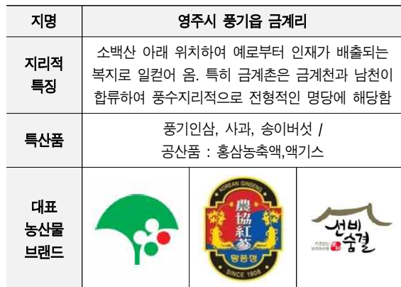
[Table. 7] 십승지 각 지역별 현황 분석

3.3.1. 십승지별 고유의 친환경 농산물 및 브랜드 발굴 지금까지 십승지에 대한 구체적인 연구가 진무한 상태에서 분야별로 세분화 하여 연구를 진행하였고 십승지를 이해하는 데 있어 가장 기본적인 자료를 아래 표와 같이 정리하였다.