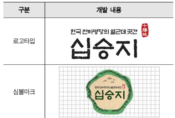
[Table. 10] 로고타입 및 활용 방안