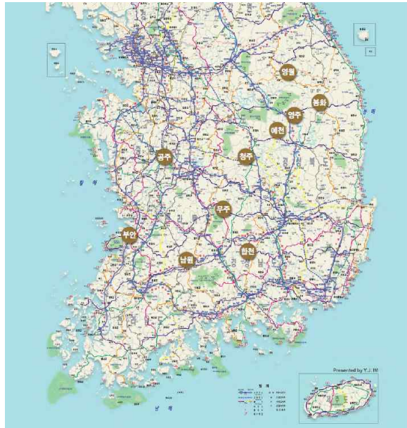
[Fig. 1] 십승지의 위치

십승지란 조선시대에 사회의 난리를 피하여 몸을 보전할 수 있고 거주 환경이 좋은 10여 곳의 피난처를 일컫는 말이다. 7) 그러나 여기서 십(十)이란 꼭 10개가 아니라 ‘많다’는 뜻을 담고 있다.