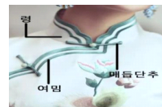
<그림 2> 치파오의 중요한 특징

개량용봉가운은 전통 용봉가운을 개량한 것으로 금·은사를 줄이고 반짝이는 액세서리를 많이 추가했다. 럭셔리해 보이지만 전통적인 용봉가운에 비해 제작 공정이 미흡하다.