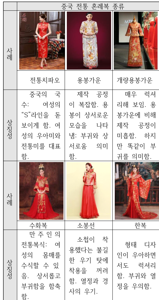
<표 4> 중국 전통 혼례복의 특성 https://image.baidu.com. 검색일, 2019.05.06

용봉가운은 맞춤 제작과 수작업 자수 용봉 문양의 필요하며 제작기간이 두 달 정도가 소요될 만큼 의상이 세밀하고 수공예적 요소가 높다. 또한 용봉가운의 용봉은 성스러운 뜻을 담고 있다. 용봉가운은 수공과 금·은사의 밀도에 따라 가운황(褂皇), 가운후(褂后), 대오복(大五福), 중오복(中五福), 소오복(小五福)으로 나눌 수 있다. 가운황 자수문양의 밀도 90%~100%, 가운후 자수문양의 밀도 80%, 대오복은 자수문양의 밀도 70%, 중오복은 자수문양의 밀도 60%, 소오복은 자수문양의 밀도 50%이다. 용봉가운을 만드는 데는 많은 인력이 필요하지만 세월이 흘러도 그만의 매력을 잃지 않는다.