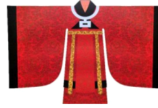
<그림 1> 송나라 적사포

중국 역대 여성 혼례복의 색채는 붉은색이 많다. 붉은색 혼례복은 준서인(准庶人) 20 이 적사포(绛纱袍) 21 를 입고 친영하는 선례에서 기원한다. 송나라(宋代)에는 궁중 명부(命妇) 22 의 혼례복이 청록색이었다. 한나라 이전에는 대부분 주제(周制) 혼례, 검정과 황색 혼례복으로 천지의 신비함을 상징했다. 중국 고대 혼례복의 공통점은 색채를 중시한다는 것이다. 혼례복은 밝은 색채와 반짝이는 액세서리를 매치한다. 중국 결혼의 주색은 붉은색이다. 남녀 혼복은 모두 붉은색이다. 빨강색은 중국에서 행운, 행복, 위엄, 생명, 흥행, 사랑, 부(富), 열렬한 열정을 가리킨다. 또한 전통적으로 축하행사에 사용되는 색이다 23 .