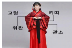
<그림 3> 한복 혼례복의 주요 특징

한복 혼례복의 주요한 특징은 교령(交領), 취완(左衽), 관소(寬袖, 키띠(系帶) 이다 29) . 즉, 교차하는 칼라를 의미하는 교령, 우임을 의미하는 취완, 큰 소매를 뜻하는 관소, 허리띠를 뜻하는 키띠 차림이며 그 너비가 넓다. 또한 색채는 주로 빨강, 검정, 진한 빨강으로 매치하였으며 문양은 용봉문양과 식물문양이 많다.