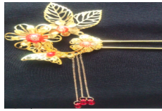
<그림 5> 보행 https://www.duitang.com 검색일, 2019.05.12.