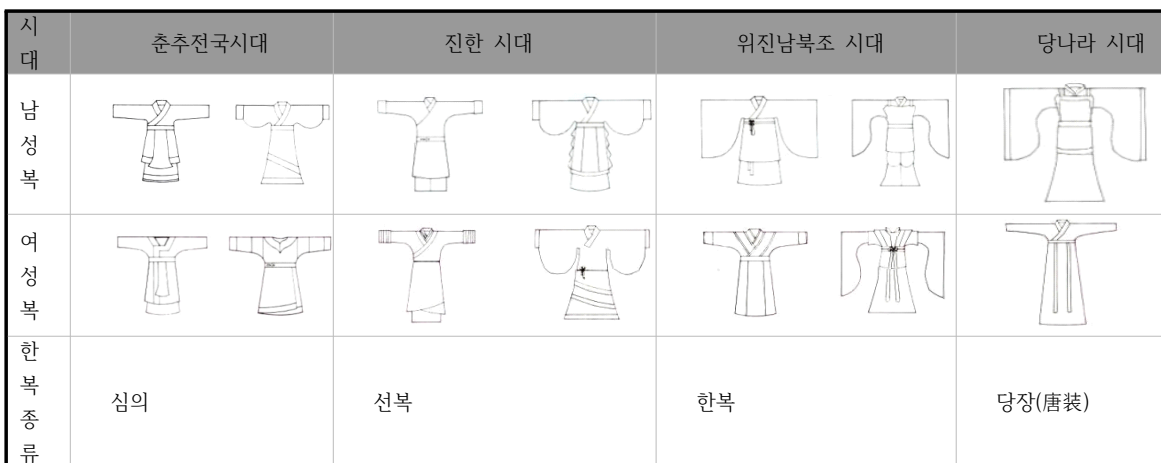
<표 1> 한복의 기원과 발전

첫째, 한복의 기본적 형식은 헐렁한 곱형 7) 과 넓은 소매이다. 춘추전국시대부터 한복은 헐렁한 곱형과 넓은