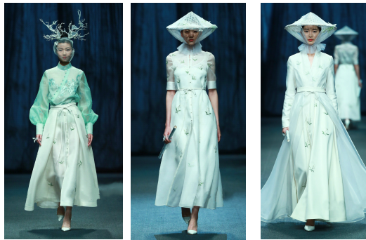
그림12 그림13 그림14

진행하였다. 클래식한 A형 실루엣의 코트를 기본 아이템으로 녹색 머리 장식과 중국 전통 오사모와 시스루 효과를 주는 아사와 롱스커트, 그 외 다른 액세서리 등의 결합은 예술적 효과를 부여하였다. 특히 톤온톤의 각기 다른 소재를 사용하여 차별하면서도 소재의 차이가 주는 깊이감을 더하였다. 그리고 쑤저우 자수를 부분 포인트로 사용하여 성현(先賢)의 이념을 전함과 동시에, 도안은 모던하게 진행하여 전통과 현대의 조화미를 보여주었다. 전체적으로는 조용하면서도 단아한 여성성을 보여주면서, 중국식 치파오의 지성미와 서양식 치마의 관능미를 잘 조화시켜 중국 한복의 미를 표현하였다. (그림12.13.14.)