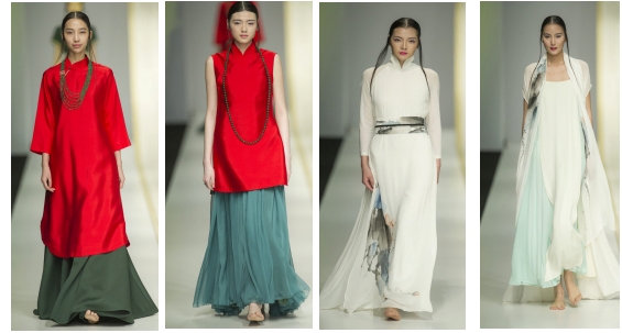
그림5 그림6 그림7 그림8 (출처:pic.haibao.com)

중국 여성복 브랜드인 길상제는 2015년 F/W 중국 상하이 컬렉션에서 '산의 미로, 물의 선'을 주제로 컬렉션을 발표하였다. 해당 컬렉션에서 발표한 모든 의상은 기본적으로 전통적인 한복의 요소를 많이 사용하였다. 다음의 그림5,6는 상의하상 양식을 사용하여 칼라의 좌우를 교차 결합하였고, 소매 스타일은 민소매 또는 박시한 긴팔, 상의, 하의로 분리하였다. 또한 상의는 솔리드 컬러인 레드, 하의는 다소 채도가 낮은 색상을 사용하였다. 길상제의 복식은 무채색 배합의 의상에서 주로 수목화를 문양으로 사용하였다(그림6,7). 또한, 칼라는 좌우 교차 형식과 스퀘어 네크라인 2가지 종류로 진행하였으며, 소매는 전통 한복보다 다소 짧게 디자인하여 현대적 감각에 맞게 재해석하였다. 전체적으로 해당 컬렉션은 중국 전통 한복 요소인 '천인합일'과 '조화자연' 등 전통 한복의 이념을 계승하고 있다고 볼 수 있다.