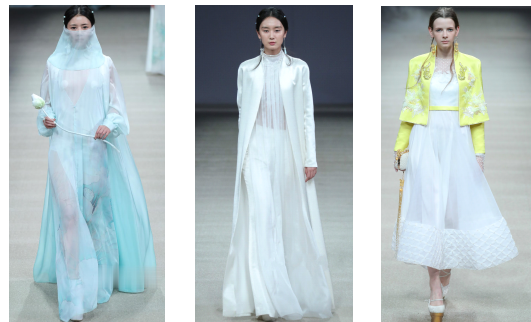
그림9 그림10 그림11

2018년 S/S 중국 브랜드인 헤븐 가이아의 컬렉션은 '승(承)'을 주제로 진행하였다. 이번 컬렉션에서는 쑤저우 자수의 공예와 수목화의 선염기법을 적용했으며 입체 커팅으로 차별하면서도 여성스러운 실루엣을 연출하였다. 또한, 거즈에 중국 전통 공필화를 문양으로 표현하여 자연스러우면서도 우아한 멋을 연출하였다(그림 9,10). 그림11의 의상은 중국 궁중의 명황색을 도입한 것을 알 수 있다. 이 의상에서는 실크를 기본 소재로 사용하며, 다양한 명도의 면과 벨벳소재를 믹스하여 중국 전통 자수 기법으로 수놓았으며, 해당 소재를 입체 재단하여 동양과 서양의 실루엣을 결합하여 동양적이면서도 동시에 서양적인 이미지를 효과적으로 표현하였다.