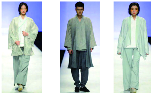
그림2 그림3 그림4 (출처:pic.haibao.com)

민족 전통복식에서 영감을 얻은 디자인이다. 의류 원단은 마를 방적하여 만들었는데, 자연을 존중하고 보호하고자 하는 중국 전통문화 중 천인합일의 이념에 부합하는 친환경 이념을 내포하였다. 그림1의 여성복은 옷깃을 좌우로 교차시키고 아우터는 넓은 소매 위에 길이를 줄이고 밑단을 문양으로 장식했으며, 슬랙스를 입어 전체적으로 조화롭고 자연스러운 느낌을 주며 단정하고 수려한 스타일을 연출하였다. 그림2의 남성복 상의는 쿨톤(cool tone)의 무채색 그라데이션 컬러의 긴 저고리를 입고 하의로는 현대적 느낌의 조거 바지를 매치시켰다. 이로써, 심플하면서도 풍부한 시각적 느낌을 주며 한복의 동일성과 호환성을 표현하였다. (그림 2,3,4).