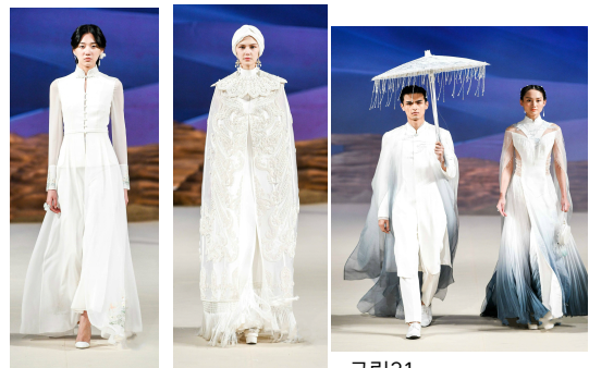
그림19 그림20 그림21

헤븐 가이아는 2019년 S/S에 '사막'이라는 대 주제 아래 '사막·행자'라는 세부 주제의 컬렉션을 진행하였다. 해당 컬렉션에는 견사, 자수, 비딩(釘珠), 반금(盤金) 15) , 매듭단추 등 많은 동양의 공예기법이 사용되었다. 그림19의 의상은 전통적인 칼라 형태를 유지하면서 여미를 모던한 버클로 교체하였고, 소매에는 시스루 소재를 조합하여 여성의 세련되면서도 온화한 분위기를 연출하였다. 그림19는 중국 서부지역의 이슬람 종교적 신앙과 서양의 정서가 어우러진 사막 행자들을 모던하게 재해석한 예술성을 내포한다. 그림20의 남성복은 서양식 양복과 중국 당나라 시대의 남성 슈트의 스탠딩 칼라를 결합시켰고, 여성복은 시스루 소재를 활용한 자켓형 롱 드레스에 전통 수목화를 프린트 하여 중국 한민족 복식을 현대적으로 재해석하였다.