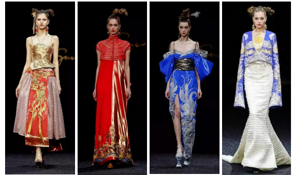
그림15 그림16 그림17 그림18

의 의상은 기본적으로 A형 실루엣과 H형 실루엣을 사용하고, 컬렉션 전반에 사용한 기법으로는 자수, 판금 등을 활용하였다.