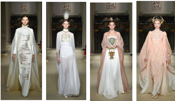
그림22 그림23 그림24 그림25

화를 주제로 '화벽(畫壁)' 컬렉션을 진행하였다. (그림 22.23.24.25) 중국 둔황 벽화에서 영감을 받아 보살, 비천 등의 불교적 요소를 결합하여, 둔황 벽화 속의 넓고 심오한 역사와 문화를 보여준다. 그림21은 치파오 양식에 서양식 긴 망토를 배합하였으며 드레스 바디 부분에 중국 전통 산수의 경지화를 융합하였다. 그림23,24의 모델 헤어 장식은 중국의 전통 헤어 장식을 적용하였고, 웨이스트 장식으로 궁등16)의 아이템을 사용하여 전통과 현대미를 아름답게 조화시켰다. 그림24는 전통 여성 한복의 대 곱형과 넓은 소매를 활용하였고 원단을 반복적으로 번지게 하는 다중 공정 처리로, 자연스러운 컬러의 효과를 주어 섬세하고 화려한 이미지를 연출하였다.