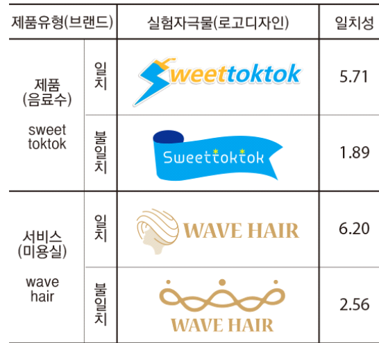
<표 2> 제품유형별 브랜드 심벌과 네임의 일치성

형상화하였다. 이렇게 개발된 브랜드로고 디자인은 3차에 걸쳐 로고의 완성도, 적절성, 심미성 등에 대한 디자인 전문가의 평가를 거쳐 최종 브랜드 디자인이 완성되었다<표 2>.