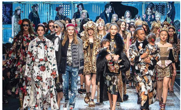
<그림 2> 17 FW 돌체앤가바나 컬렉션

과 재미와 유머를 추구하는 요소들을 디자인에 도입함으로써 맥시멀리즘의 조형성에 몰입하였고 그 특징을 새 천년의 패션에 직접 표현하였다.” 20) 패션디자인에서 맥시멀리즘 경향은 주로 화려함, 장식성, 섬세한 표현에 의한 디자인으로 나타나고 있으며, 이러한 현상과 디자인 특징들이 패션에서 다양성과 많음을 표현하는 미학적 경향인 맥시멀 룩 (Maximal Look)으로 형성되었다. “맥시멀 룩은 디테일한 표현이나 장식적인 요소가 두드러진 특징으로 실루엣을 과장되게 표현하고 다양한 요소의 혼합을 추구하는 의복 스타일과 복고적인 성향이 반영된 모든 디테일과 과장된 장식 그리고 재미를 추구하는 양식적 특성을 일컫는다. 인간의 감성에 충실하고 과거와 전통에 대한 관심을 드러내는 현상으로, 고급스러움을 추구하고 화려함의 새로운 의미를 개척하는 것이다.” 21)