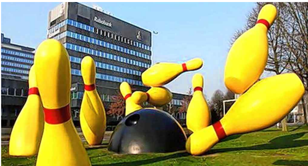
<그림 1> Oldenburg (Flying Pins 2000)

스웨덴 태생의 미국조각가 클래스 올덴버그(Claes Oldenburg, 1929~ )나 제프 쿤스(Jeff Koons, 1955~ )는 작품에서 사물의 크기를 비정상적으로 확대하거나 사물의 소재의 속성을 바꾸어 표현 하였다. 공중전화, 변기, 풍선, 타자기, 같은 일상생활의 소재들을 부드럽고 유동적으로 제작하였다. 단단한 사물이 부드러운 소재 또는 운동감 있게 표현되면 대상의 크기가 변형되었을 때만큼 낯설고 이질적인 느낌을 받게 된다.