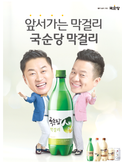
<그림 7> 국순당 생 막걸리 포스터

생산 지역 내에서 주로 판매가 이루어지곤 했는데 국순당은 '발효제어기술'과 '냉장유통'의 도입으로 생막걸리의 유통기한을 30일까지 늘렸다. 10)