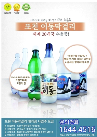
<그림 6> 포천 이동 막걸리 포스터

40여 곳의 전국대리점을 운영하며 국내 대형할인점 및 편의점에서 판매 중이고 일본과 미국으로 지사를 설립, 여러 해외시장으로 수출 확장하여 2003년도에는 수출금액 일백만 불을 달성하였으며 매년 15~30%의 성장을 지속하고 있다.