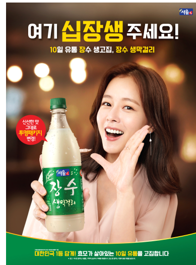
<그림 4> 서울 장수 막걸리 포스터

여 전통성을 유지하고 3원색 컬러로 활동적이며 페스티벌 형식의 도형으로 축제 분위기를 연출하였으며 용기의 그린색상을 통해 친환경, 친근감을 표현하고 있다.