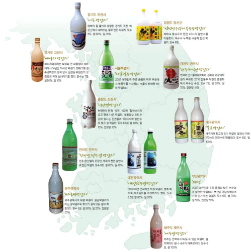
<그림 3> 지역별 대표 막걸리8)

우리나라에는 1,000여 종류가 넘는 막걸리가 지역방방곡곡에서 만들어 지고 있다. 지역의 환경과 특산물의 첨가로 비슷하게 보여도 서로 다른 향과 맛을 선보이고 있다. 연구자는 여러 종류의 막걸리 중 지역에서 인지도가 높은 막걸리 5종을 선택하여 분석, 정리하였다.