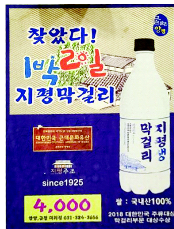
<그림 5> 양평 지평 막걸리 포스터

정리된 듯 한 로고타입은 깔끔함과 전통을 강조하는 것 같고 푸른색 포인트 컬러를 사용하여 제품에 대한 믿음과 안심을 느끼게 한다.