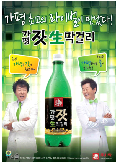
<그림 8> 가평 잣 생 막걸리 포스터

첨가됨을 강조한 라벨디자인에서 잣 이미지와 블랙컬러를 배경으로 '잣'글자와 회사 CI가 강조된 레이아웃으로 안정적이고 믿음이 가는 디자인이다.