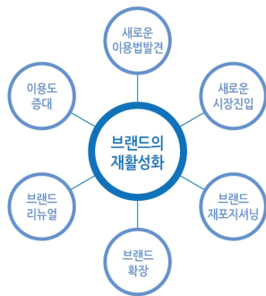
<그림 2> 아커의 브랜드 재활성화 모형6)

무엇보다 브랜드를 재활성화 하는 가장 큰 목적은 소비자에게 오랜 기간 사랑받을 수 있는 롱런브랜드(Long-Run Brand)를 구축하기 위함이라 할 수 있다.