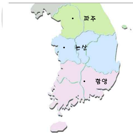
<그림 3> 권역별 재해구호물품 광역창고

재해구호물품창고의 업무 중 가장 중요한 것은 적절한 구호물품을 보관할 수 있는 공간 확보 및 적절한 환경, 창고의 관리 및 운용, 차량 진·출입의 용이성 등이다. 적절한 창고의 확보가 결코 쉽지 않으므로 재해구호물품창고의 전문화를 기할 필요가 있다. 또한 동 업무는 물류관련 비전문가인 사회복지 담당공무원에 의하기보다는 전문가에게 일임하는 것이 효율적 재해구호를 위하여 바람직하다는 관점도 제시되었다. 그러므로 재해구호물품창고 관련 업무는 전문 민간단체에게 위탁하고 실비를 변상하는 것이 효율적일 것이다.