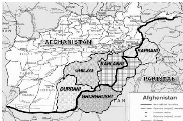
NOTE: Adapted from Johnson and Mason, Understanding the Taliban and Insurgency in Afghanistan .

한편, 대체로 각 부족단위 별로는 공통된 언어와 전통과 관습, 그리고 혈통적 동질성으로 인해 단일한 정체성과 소속감을 공유한다고 하지만 이들 부족들은 보다 더 세분화된 소 부족(sub-tribe)과 씨족(clan) 등으로 나뉜다. 그리고 같은 부족 내에서도 이러한 세부단위의 소 부족 또는 씨족들은 각각의 정체성을 가지며 서로 독립적으로 존재한다. 그리고 종종 같은 부족내의 다른 소 부족이나 씨족들 사이에서도 갈등이나 이해관계의 충돌 그리고 반감 등이 나타나게 되며 하나의 동질집단으로서 강한 연대의식이나 공동체 의식은 희박하게 나타날 수 있다(Afsar, Samples, & Wood, 2008: 62). 예를 들면 다음의 그림 2는 같은 파슈툰의 부족단위가 어떻게 보다 하위단위의 서로 다른 소 부족과 씨족들로 나뉘지는 지를 보여준다.