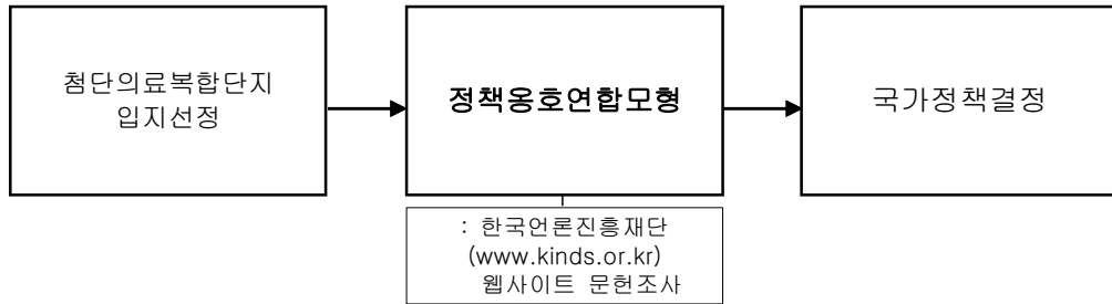
<그림 3> 첨단의료복합단지 입지선정의 분석방법 및 절차