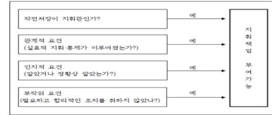
<Fig 1> The Framework of Analysis of Command Responsibility

지휘책임 관련 국제 및 국내 법규를 분석하고, 선행연구를 검토한 결과 지휘책임은 “군 지휘관 또는 사실상 군 지휘관으로 행동하는 자”에게 부여하는 책임이다. 또한 지휘책임에 대한 성립요건은 “제 1요건인 관계적 요건, 즉 지휘관에 의해 실효적인 지휘와 통제가 이루어져야 한다. 제2요건인 인지적 요건, 즉 지휘관이 알았거나 당시 정황상 알았어야 한다. 제3요건인 부작위 요건 즉, 지휘관이 권한 내의 모든 필요하고 합리적인 조치를 취하지 않았어야 하는 경우이다. 이 세가지 요건이 성립 되었을 때 지휘책임을 지울 수 있다[5]. 따라서 천안함 피격사건 시 함참 작전처장의 지휘책임 유무는 작전처장이 지휘관인가? 세 가지 법적요건인 관계적 요건, 인지적 요건, 부작위 요건이 성립되는가를 분석하면 확인 할 수 있다. 따라서 이 4가지 요소를 분석의 틀로 사용하였다.