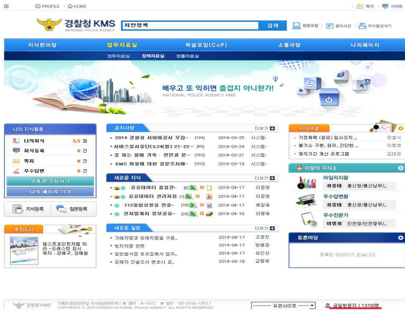
〈그림 2〉 경찰청 지식관리시스템

경찰은 지식관리시스템 시행에 이어 지식행정 기반 구축을 위해서 지속적인 노력을 전개하였으며, 2009년에는 다년간 축적된 지식을 효율적으로 관리하고 사용자 편의성을 강화한 시스템 환경을 제공할 필요성이 대두되는 등 지식관리시스템에 대한 활용상의 요구와 서비스 제공에 있어서 변화가 절실히 필요하게 되었다. 따라서 버전(Version) 지식 도입, 위젯(Widget) 개발 등 사용자의 수요를 바탕으로 시스템의 완성도를 높여 지식관리시스템의 고도화 기반을 마련하는 노력을 전개하고 있다.