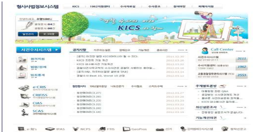
<그림 4> 경찰 KICS 메인 포털화면

또한 지능화, 다양화하는 범죄에 대응하기 위해 범죄정보의 체계적 관리를 목적으로 구축한 범죄정보분석시스템(CIAS: Criminal Intelligence Analysis System)과 연계하여 신속한 내사·수사 착수를 가능하게 하였다. 이는 범죄정보, 사건자료, 인터넷·언론 등 공개 범죄정보의 통합 DB를 구축하고 종합적·과학적 분석 기능을 시스템에 구현하여 일선 수사기관에 자료를 제공할 뿐만 아니라 미래 치안정책 설계에도 활용하고 있다(경찰청, 2013: 174).