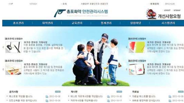
<그림 3> 총포화약안전관리 전산시스템 내부망

이를 통해 경찰공무원은 총포·화약류 관련된 업무에 있어서 서버, 시스템 구축 및 소프트웨어 도입 등으로 운영 기반의 확충과 범죄자 정보시스템(CIMS)과의 연계로 행정전자정보 공유가 가능하다. 또한 총기 입·출고 사항의 조회 등이 가능하여 총포·화약류의 안전관리가 가능하다.