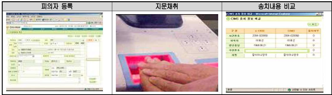
<그림 5> E-CRIS 처리도

서 활용하는 수사자료표를 ‘전자 수사자료표 DB 및 공유서비스체계구축’사업을 추진한 결과로 등장하게 되었다. 2005년 행정안전부 주관 ‘행정정보 DB 구축 공공사업’의 일환으로 2005년 말까지 총 144억 5천만 원의 예산을 투입하여 구축한 시스템이다. 이를 통해 경찰공무원은 수사 활동 시, 컴퓨터를 이용하여 피의자의 주민등록번호만 입력하면 성명·주소 등 주민자료가 자동 입력되고, 생체지문인식기를 이용하여 지문을 채취하면 보관된 주민지문 DB와 비교하여 현장에서 피의자 일치여부를 확인 가능하다.