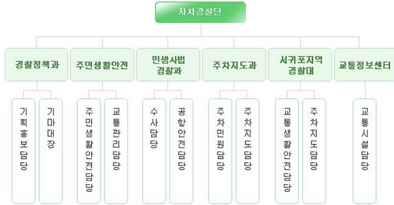
<그림 1> 제주특별자치도 자치경찰단의 조직구성