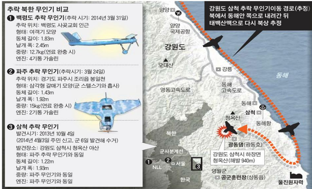
<그림 2> 북한 무인기 위협