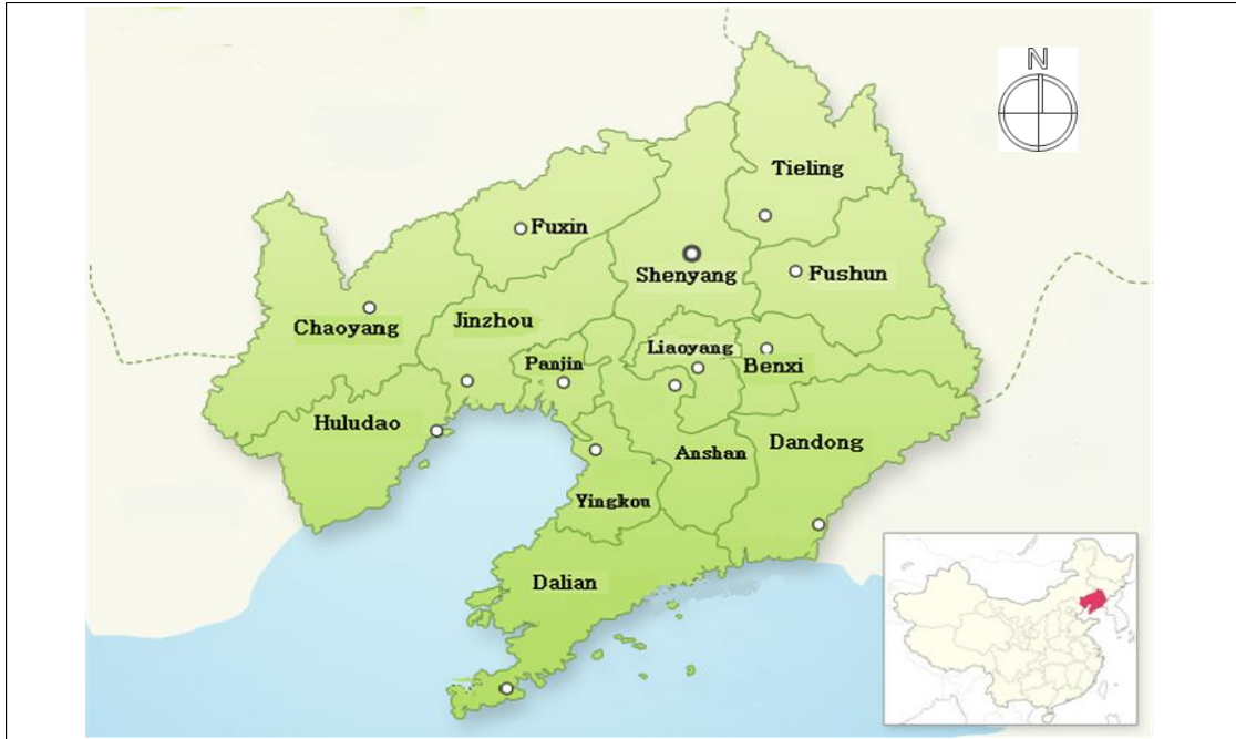
<Figure 1> The Selected Study Area (Liaoning, China)