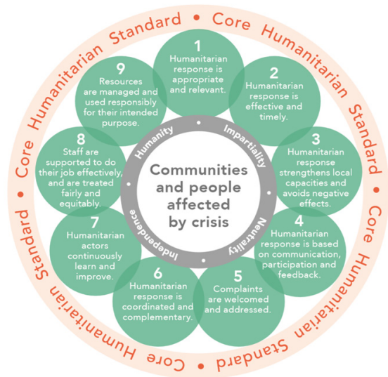
Figure 1. The core humanitarian standard on quality and accountability 5)

앞에서 살펴 본 것처럼, UN과 같은 국제기구들과 국제적 구호단체들의 활동을 통하여 NGO의 국제구호활동을 규율하는 규약이나 가이드라인들이 만들어지고 있다. 국제구호를 위한 NGO 활동의 가이드라인에 대한 고민들은 이전부터 있어 왔다. ICRC(International Committee of the Red Cross)와 IFRC(International Federation of Red Cross and Red Crescent Societies)는 국제적 재난 구호에 있어서 주도적 역할을 하는 국제적 NGO이다. IFRC는 재난 구호에 대한 국제법의 전개가 담보 상태에 있다는 점을 지적하며 우려를 표명하였다. 즉, 재난 관련 문제가 국제법상 주변부에 위치하고 있으며, 재난 관련 국제법의 접근은 파편적이고 산발적으로 진행되어 왔음을