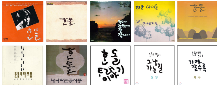
〈사진 2〉 흔돌의 트래 음반

흔돌은 1989년 2월 28일, 성음을 통하여 흔돌트래모음·1 『흔돌』(작사·작곡·노래: 흔돌, 편곡: 이정선, 〈사진 2〉의 위에서 두 번째)을 발매하면서 〈지쳐버린 밤〉, 〈쓸쓸한 사람〉, 〈휴무일〉 11) , 〈무궁화〉, 〈가지꽃〉 12) , 〈티〉 등 9곡을 알렸다. 흔돌은 음반 소개에서 ‘트래’의 속뜻(각주 3)을 밝혔다. 여기서 그는, ‘느끼는 노래’로서의 “트래는 리듬을 위해서 노랫말이 있어야 하는 것이 아니고, 노랫말을 위해서 리듬이 곁들여지는 것이어야 한다. 한국적인 가락은 우리의 삶을 피부로 느낄 수 있어야 한다는 것이 나의 생각이다. ‘한국은 세계로’가 아니라 ‘세계 속의 한국’을 지키면 되는 것이다.”라고 강조하였다. 이런 확신은 국수주의 성향으로 해석될 여지가 있다. 이 말대로라면, 트래에서의 노랫말(서사)은 노랫가락(음악)보다 비중이 더 커야 하고, 또 생생한 삶의 이야기를 담아야 한다. 지금 생각하면 의아한 주장이지만, 그때 시대 분위기 13) 를 고려