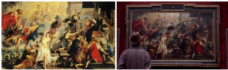
〈그림 5〉 루벤스의 〈앙리 4세의 죽음과 마리 드 메디치의 섭정 선포〉

의 두 번째 정부인인 마리 드 메디치(Marie de Medici, 1573~1642)의 생애를 그린 연작 21점을 전시하고 있다. 그중 하나인 이 그림은 1610년, 앙리 4세가 암살을 당하고 마리 드 메디치가 어린 아들(루이 13세) 대신 섭정을 맡는 순간의 그림이다. 메디치 가문의 마리는 여성 편력이 심했던 앙리 4세와 순탄치 않은 결혼 생활을 하였다. 1617년, 루이 13세의 친정 선언으로 권력에서 밀려난 마리는 아들과의 끊임없는 정쟁으로 유배와 반란, 화해, 유랑을 거듭하다가 독일 쾰른에서 병사한다. 얼핏 엘렌 올렌스카 백작부인의 파란만장한 생애와 겹쳐진다.