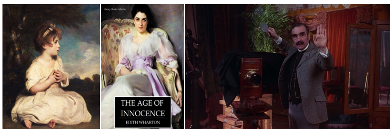
〈그림 1〉 회화와 소설, 영화의 상호텍스트성

영화 서사는 욕망의 주체와 대상의 간극을 넓힘으로써 관객을 이끈다. 또 그 서술의 기교는 욕망의 대상을 활성화해 욕망의 주체가 욕망을 추구하도록 조정하는 데 있다. 9) 영화 주인공의 욕망의 실현은 이야기가 끝날 때까지 연기되고, 방해받고, 위협받음으로써 성취되지 않을 수 있다. 10) 뉴랜드도 엘렌과의 결합이 가능한 순간마다 부족의 규범으로 도피함으로써 엘렌을 도달할 수 없는 대상 소타자로 머물게 한다. 11) 관객은 뉴랜드가 파리의 엔딩 장면에서 엘렌에게 다가가지 못하는 모습을 보면서 ‘스크린을 통한 시선의 열망 12) 으로 안타까움을 느낀다. 어떤 의미에서 이 이야기는 오이디푸스의 신화, 즉 욕망과 금기의 갈등을 재현한 것이기도 하다.