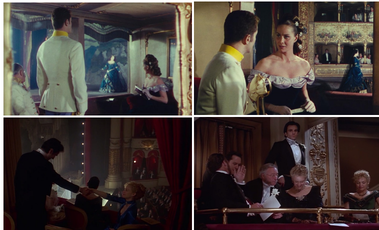
〈그림 6〉 <센소>(上)와 <순수의 시대>(下)의 박스석 신

장, 이 두 곳의 무대와 박스석이 대상이다. 이 장면들은 루키노 비스콘티(Luchino Visconti, 1906~76)의 <센소>(Senso, 1954)의 박스석 신scene과 분위기가 유사하다. <센소>의 시작은 베르디(Giuseppe Verdi)의 <일 트로바토레>(Il Trovatore)가 공연되는 라 페니체 극장이다. 오페라와 영화가 복수를 주제로 하므로, 여기서도 상호텍스트성의 아이러니가 인지된다. 이 영화에서 프란츠 중위와 리비아 백작부인의 첫 만남은 박스석에서 이루어지는데, “박스석의 거울과 창틀은 장면의 공간적 깊이와 공감각적 심상을 시각적 일루전을 통해 드러낸다.” 30) (그림 6의 上) <센소>에서 “비스콘티가 추구하는 탐미주의의 성향은 공간적 깊이가 상당하다. 인물의 심리를 거울 효과나 액자 효과로서 강조하면서, 그 자연스러운 표현을 통해 회화적 전통을 영화 속에 이식한다.” 31)