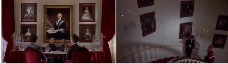
<그림 2> 상류 사회 최고 법원의 상징, 벤 더 루이든 가의 초상화