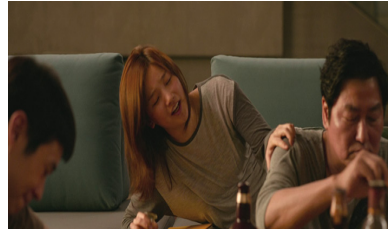
⑧ 기정을 외면하는 부자

기택: 저기, 기우야. 씹, 거시기 왜. 그 윤 기사, 윤 씨 맞지? 원래 이 집 운전기사 하던 놈.