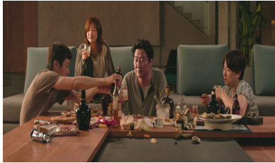
⑦ 기택을 위로하는 아들