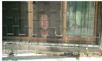
② 순교자적 희생과 감내

소독차의 연기를 방으로 들여서 꼽등이를 쫓아내면서도, 쉬지 않고 피자 상자를 접는 아르바이트를 해야 하는 열악한 상황 속에서 기택은 별달리 도움이 되지 않는다. 피자 가게 사장이 불량률을 지적하는 장면은 그런 기택의 위치를 시각적으로 강조한다. 피자 가게 사장은 박스 네 개 중에 한 개꼴로 불량이 나온다면 “넛 중 하나는 불량인 거지.”라고 비난한다. 그러자 등장인물들의 시선과 화면의 초점이 기택의 얼굴로 집중된다.(그림 ①) 그는 가족 중에서 가장 ‘불량’으로 공인되는 것이다. 피자 가게 사장이 “패널티”로 가격을 깎겠다고 하자 충숙은 적극적으로 항의한다. 아내가 억척스러운 생활력을 발휘하고 분노하는 동안, 기택은 반지하 방의 창틀과 방범창에 갇혀서 그런 아내를 묵묵히 올려보고 있다.(그림 ②) 이 모든 사태가 자신의 죄인 것처럼 인정하고 감내하는 순교자의 형상인데 17) 그는 차분하고 맑은 얼굴을 하고 조용히 눈을 감는다. 이러한 기택의 인물 설정은 한국 문학에서 반복되었던 무능하지만 착한 아버지의 자의식을 연상시킨다. 역사적 질곡과 경제적 위기로 인해 무능해진 한국의 가부장은 억척스럽게 가정 경제를 꾸리는 아내에