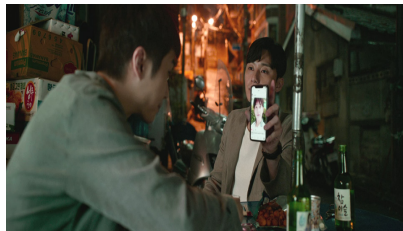
③ 다혜의 ‘전달’과 ‘보호’의 인계

수석을 전해준 민혁은 곧이어 자신이 하던 과외를 소개해 주는데, 이 ‘전달’ 역시 남성적 주체화와 긴밀하다. 민혁은 돈이 필요하다거나 과외를 해보겠다는 질문으로 과외 정보를 전하지 않는다. 다혜의 사진을 보여주면서 “귀엽지?”라고 물으면서 시작한다.(그림 ③) 그다음에서야 “부잣집 과외야 돈도 많이 줘. 애도 착해.”라는 과외의 조건을 소개한다.