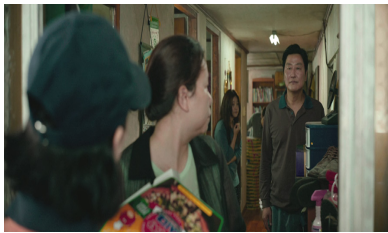
① 불량 가부장을 향한 지목