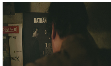
⑩ 동의를 애도하는 기택