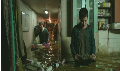
⑤ 물속에서 떠오르는 수석