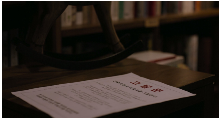
<그림 2> 동인의 고발문

요약하고 편집하는 필자가 되었다. 그러나 이 첫 기록에 기입된 삭막하고 앙상한 언어들, 그가 겪은 일을 담기에는 너무 비좁았다.