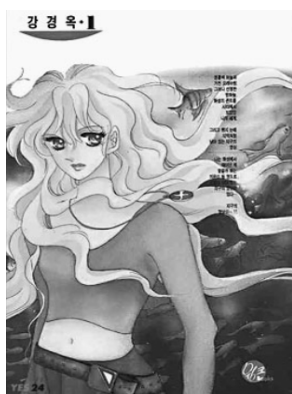
〈노말시티〉의 유전자 복제인간 ‘마르스’