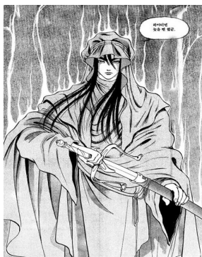
〈레드문〉의 외계인 ‘사다드’