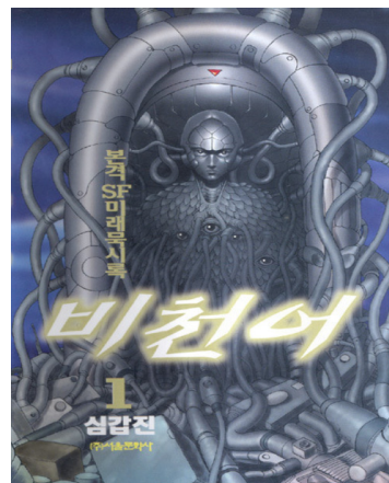
<비천어>의 인간 '나오'와 결합한 생명체 '사이'