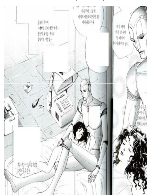
〈나무 박사를 찾아서〉의 로봇 ‘나물리’