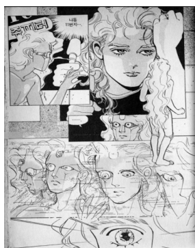
〈휴머노이드 이오〉의 안드로이드 ‘이오’