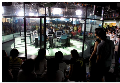
〈그림 4〉 초기 스타크래프트 경기장

프로레슬링은 매주 펼쳐지는 레귤러 경기 뿐 아니라 많은 인원이 운집하는 레슬매니아와 같은 연례적 이벤트를 펼친다. 스타크래프트의 경우에도 결승전과 같은 특별한 경기는 대규모 관중이 운집하는 이벤트로 경기의 성격을 변화시켰다. 2004년도 'SKY 프로리그'의 경우 부산 광안리 해수욕장에 10만 관객이 입장한 것으로 추정될 만큼 당시 스타크래프트는 엔터테인먼트 이벤트로서 강력한 파급력을 지니고 있었다. 자신들의 정체성을 스포츠가 아닌 엔터테인먼트와 쇼에서 찾는 미국 프로레슬링 단체 WWE 23) 와 e스포츠, 초기 스타크래프트 중계방송은 이처럼 많은 부분들에서 유사점을 보인다. 이벤트 경기에서 스타크래프트 중계 캐스터는 마치 격투기나 프로레슬링의 링아나운서처럼 높은 성량으로 선수를 소개하며 관중의 분위기를 끌어올린다. 중계 부스가 아닌 현장에서 고품에 가까운 소리를 내며 현장음과 섞인 중계로 현장감을 전달하는 방식도 프로레슬링과 스타크래프트 중계 방식이 같다.