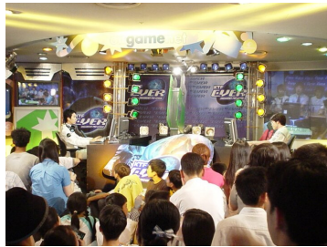
〈그림 3〉 초기 스타크래프트 경기장