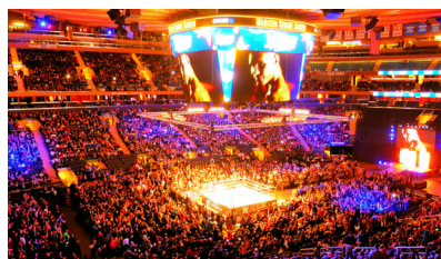
〈그림 2〉 프로레슬링 WWE 경기장

e스포츠와 미국 프로레슬링 경기장 모두 화려한 조명과, 작은 경기 공간 21) 을 집중시키는 무대 양식과 대형 스크린의 활용, 록음악과 같은 강한 비트의 음악을 활용하는 것을 볼 수 있다. 이러한 장치들은 현장의 관객을 집중시키고 그들을 열광시킴으로써 엔터테인먼트를 극대화시키기 위한 것이다. ‘프로레슬러가 관중 앞에서 퍼포먼스를 할 때, 프로레슬러의 가치와 능력은 관객들에게 열광적 반응을 이끌어 내고 강한 인상을 주었는가로 평가된다.’ 22) 그만큼 관객과 그로 인한 현장성이 중요하다는 것이다. 아래의 초기 스타크래프트 리그 경기장의 사진들을 보면, ‘그림3’의 손에 닿을 듯 경기장과 가까운 관객, ‘그림4’를 보면 아예 링을 형상화한 것과 같은 경기장은 미국 프로레슬링의 모습과 상당히 유사해 보이며, 그 핵심은 관객의 접근성과 현장감으로 볼 수 있다.