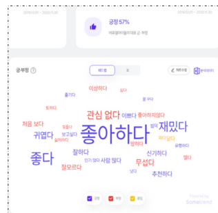
〈표 2〉 2020