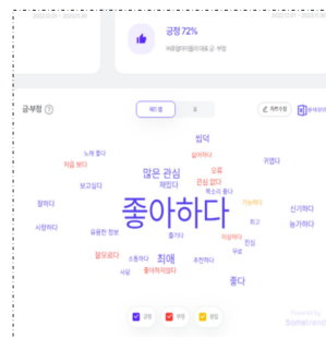
〈표 3〉 2023