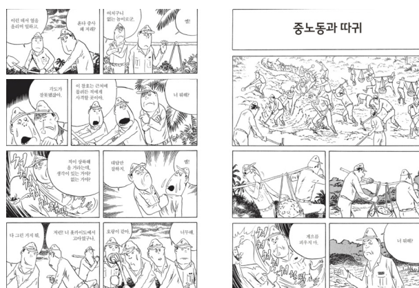
〈그림 2〉 〈전원 옥쇄하라!〉, 48-49쪽.

신병들을 괴롭힌다. 특히 그는 자신에게 쏟아지는 따귀 세례를 텍스트에 자주 등장시키는데, 코믹한 방식으로 그리고 있지만 이러한 폭력이 부당하다는 인식 역시 분명히 드러난다.