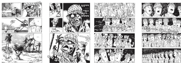
<그림 1> <전원 옥쇄하라!>, 340-341; 346-347쪽.

에 놓는다. “나는 어째서 이런 괴로운 임무를 하지 않으면 안 되나”, “이 모든 게 국가 위한 일” 25) 이라는 노래를 부르며 군인들은 옥쇄를 결행한다. 이 구절은 <일본 현대사>에서도 반복해서 등장하며 동원된 국민의 마음을 표현한다. 26) 국가를 위한 영광스러운 죽음이라는 프로파간다에도 불구하고, 군인들은 죽음을 눈앞에 둔 자로서 자신의 삶을 비판할 수밖에 없었다. 이는 ‘위안부’와 자신을 동일시하는 데까지 이어진다.