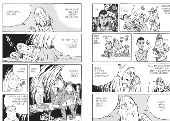
〈그림 4〉 미즈키, 〈일본 현대사〉 2, 310-311쪽.

행을 포기하지 못하는데, 이 과정에서 그는 희망을 느낀다. 손상된 신체를 표현하기 위해 제대로 눈을 뜨지 못하는 얼굴을 그렸지만, ‘아기 냄새’와 같은 ‘천국의 향기’를 느낀 이후에는 안경을 쓴 미즈키의 모습으로 돌아온다. 별다른 치료 없이 손상된 팔이 낫는 비일상을 경험한 것이다. 미즈키는 손상에서 회복하는 과정을 선주민과의 만남으로 설명하고, 이는 ‘천국’으로 묘사된다. 선주민 마을에서 환대받으며 휴식을 취한 것이 손상의 치료와 연결된 것이다. 이러한 경험은 미즈키가 전쟁을 기억하는 방식에 큰 영향을 미친다.