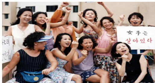
그림 3. 여성 권익을 위해 투쟁하는 여자들(《개 같은 날의 오후》 중)

력의 피해자가 되나 그 구도를 뒤엎고 스스로의 연대 방식을 구축함으로써 세계의 변화를 만든다(그림 3).