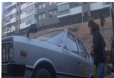
〈그림 1〉 아파트로 이사진 애마 (〈애마부인〉 중)

배창호 감독의 <적도의 꽃>은 1980년대 주거 공간을 좀 더 적극적으로 활용한 영화다. 영화는 로케이션 장소가 된 압구정동 현대아파트를 원경으로 비추며 시작하고, 이윽고 그중 한 집 안으로 이동하여 직장에 적응하지 못하고 순수한 사랑을 찾아 헤매는 미스터 M(안성기)의 시선으로 다가간다. 생활비를 보내주는 부모 밑에서 뚜렷한 일이 없이 소일거리를 하던 그는 망원경으로 다른 집을 들여다보다 이사 온 선영(장미희)에게 관심을 갖는다. 이후 그는 선영의 일상을 훑쳐보고(그림 2), 그녀를 미행하며 집에 전화를 거는 데다 불륜 상대 성두(남궁원)의 아내에게 연락해 관계를 파탄낸다. 이어 선영이 만난 또 다른 남자 준한(신일룡)을 차로 치고, 선영에게 마저 폭력을 휘두르는 등 가학 행위를 이어간다. 결국 선영은 아파트 안에서 가스를 틀어 자살하고, M은 비탄에 빠진다.