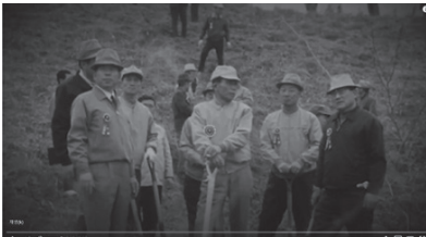
<사진 3> 1969년 4월 식목일 행사 <대한뉴스> 712호

박정희는 직접 건설 현장을 시찰하는 모습을 수시로 시청각 매체를 통해 보여줌으로써 국민에게 '신뢰'를 얻었다. 박정희 정권이 초기 추진했던 국토 개발의 주된 내용은 간척사업이었다. 자본력이 부족했던 정부는 농업, 산업, 국토건설 개발 등 전방위적인 국가재건을 위해 국민들의 힘이 필요했고, 이들의 적극적인 참여가 필요했다. 따라서 뉴스영화와 문화영화를 이용했으며, 이러한 과정을 통해 산림녹화 등을 포함한 국가 정책에 자발적 참여를 유도할 수 있었던 것이다.