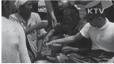
〈사진 2〉 모내기 후 농민들과 막걸리 마시는 박정 희(1961년) 〈대한뉴스〉 318호

수시로 강조하였다. 그리고 농업장려 정책과 모내기 사업을 부흥시키기 위해 다양한 방면으로 ‘노력하는’ 모습을 보여주었다. 1961년 박정희는 5.16 군사쿠데타 한 달 뒤에 제작한 뉴스 영상을 통해 ‘권농일’ 당시 윤보선 대통령과 박정희 국가재건최고회의 부의장이 각계의 인사들과 함께 직접 모내기를 하고, 농민들과 막걸리를 나누어 마시는 등의 〈사진 1〉, 〈사진 2〉의 모습을 화면을 통해 보여주었다.