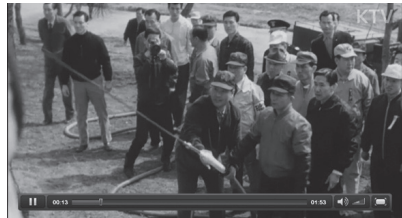
<사진 4> 1969년 전국의 녹화현장 격려 <대한뉴스> 712호

<대한뉴스>를 제작하여 상업영화를 상영하는 극장에서뿐 아니라 이동 상영차를 통해 이동 영사로 농촌마을에서도 상영하는 등 전국적으로 홍보에 나서기도 하였다. 박정희 정권은 '정권 차원'이 아닌 '민족사적' 입장에서 일대 전기를 마련해야 하고 이를 위하여 전국민의 총력을 집중하고, 국정의 최우선 과제로 국토녹화를 삼아야 한다고 강조하며 산림녹화 사업에 대한 단기간의 성