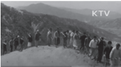
<사진 5> 1966년 산림녹화 범국민운동 실시 <대한뉴스> 564호

박정희 정권의 산림녹화와 관련한 <대한뉴스>의 내용은 1966년을 기점으로 이전 시기에는 대체로 홍수 피해를 막기 위한 산사태 방지의 사방사업에 집중되어 있었다. 그러나 1966년 이후 <대한뉴스>는 산림녹화에 대한 범국민운동 전개와 맞물려 식목일 행사뿐 아니라 산림녹화, 산림청 발족 등 다양한 내용의 산림정책을 제작, 상영하였다.