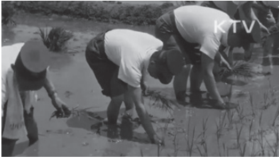
〈사진 1〉 권농일 모내기 참여하는 박정희(1961년) 〈대한뉴스〉 318호