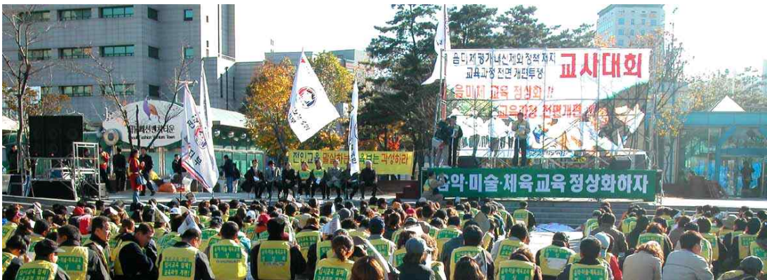
[사진 2] 전국 음·미·체 교사대회

김현경은 ‘음미체 등급 폐지 정책’ 폐기의 성과를 거두고, 미술교육발전공동대책위원회 활동백서를 발간 후 사무국장직을 다른 사람에게 인계한 뒤 잠시 한국을 떠났다. 2005년 미국에서 돌아온 그녀는 ‘학교 복직’ 과 ‘K문화예술교육진흥원’ 이라는 선택의 기로에 섰다. 그녀는 학교에서 1년 4개월 정도 더 근무하면 안정적인 연금을 받을 수 있었다. 하지만 그녀는 문화예술교육 정책의 도입기(2004~2006)가 되는 중요한 시기에 예술교육 정당성 확보와 정책당국(문화관광부)이 이를 정책 수립에 활용할 수 있도록 K문화예술교육진흥원에서 일하기로 결정하였다.