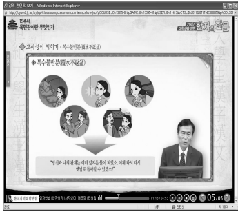
<그림3> 만화 활용 고사성어 학습

강의 콘텐츠는 학생들의 학습을 돕기 위한 다양한 장치들이 구성되어 있는데 <그림3>에서처럼 만화를 이용해 학생들이 지루해 하지 않도록 구성되어 있는가 하면, <그림4>에서처럼 학생의 이해를 돕기 위한 어구풀이가 어떤 화면에서도 제공될 수 있도록 링크되어 있다.