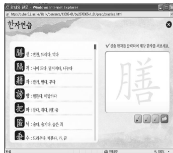
<그림2> 한자 연습