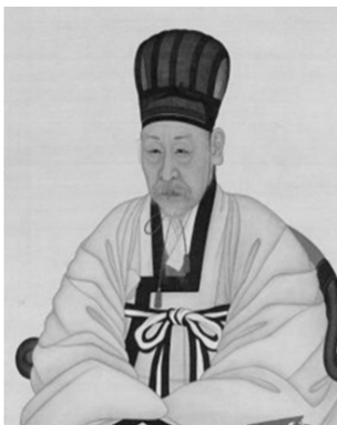
[그림 4] 허전 초상