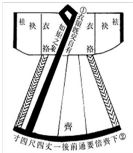
[그림1] 『家禮輯覽圖說』 심의도