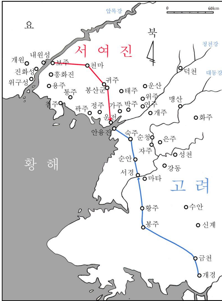
【표 1】 고려 거란 1차전쟁 때 거란군의 진격로