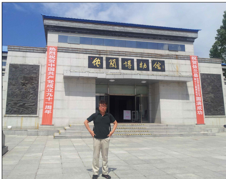
【사진 1】 依蘭縣의 박물관

2012년 8월에 이 연구를 위해 필자는 1차 원정의 전투지가 위치한 黑龍江省 依蘭縣을 방문한 바 있다. 의란현에서는 중국 사료를 망라해서 의란현 관련 자료를 古代부터 모두 뽑아 縣史를 작성해 박물관에 체계적으로 전시해 놓고 있었다. 그러나 정작 의란현 내에서 벌어진 이 1차 원정 전투에 대해서는 전혀 모른 채, 흑룡강 일대에서 1660년대 이후에 벌어진 청과 러시아의 다른 무력 충돌을 일부 소개하는 정도에 그쳤다. 하얼빈에 있는 흑룡강성 박물관도 사정은 마찬가지였다. 이는 결국 나선정벌로 불리는 두 차례의 전투에 대해서 중국 측 자료가 거의 없기 때문인 듯하다. 이에 대해서는 각주 9)를 참조.