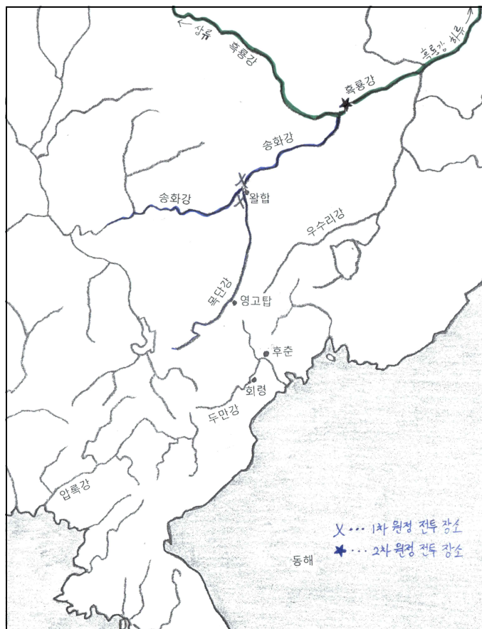
【지도 2】 1, 2차 나선정벌 당시 전투 지역

守 등 15명, 총에는 맞았으나 경상자가 鐘城 포수 申景民 등 11명이었다. 사망자에 대해서 청군 사령관은 화장을 하라고 했으나, 신유는 조선의 예법에 화장이 없으며 그렇다고 시신을 메고 귀국할 수도 없으니 매장을 하겠다고 하고는, 흑룡강가 약간 높은 언덕에 同郷끼리 묻어주었다. 79)